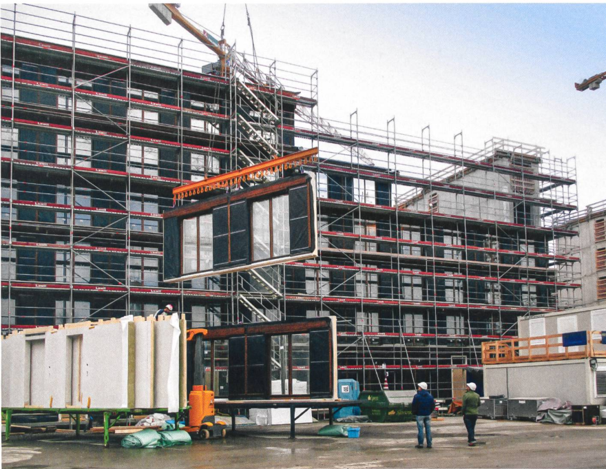
Die Holzrahmenelemente für die drei Bauten auf dem Freilager-Areal lieferte Renggli vorgefertigt auf die Baustelle. Fertigung, Montage und Logistik mussten präzise abgestimmt werden.