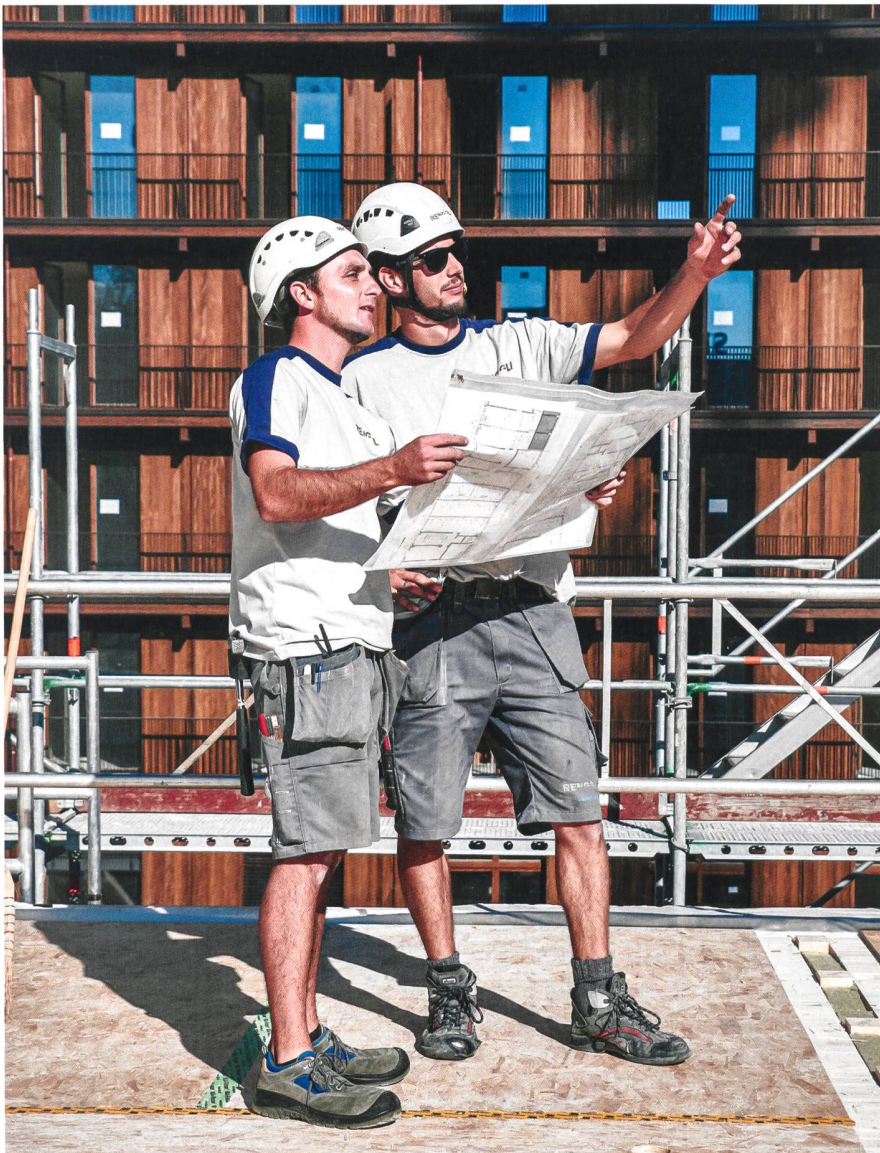
Die Kommunikation unter allen Beteiligten bildete ein Schlüsselement für das Bauen im dichten städtischen Umfeld.

des alte Haus zu sanieren. Über eine saubere Planung kann man auch zu einem anderen Entscheid kommen. Gerade bei Objekten, die nicht energieeffizient sind und räumlich nicht mehr stimmen, ist der Ersatz vielleicht der bessere Weg. Natürlich gibt es Zeitzeugen, die man schützen muss. Aber bei vielen 1940er-, 1950er- oder 1960er-Bauten muss man an die