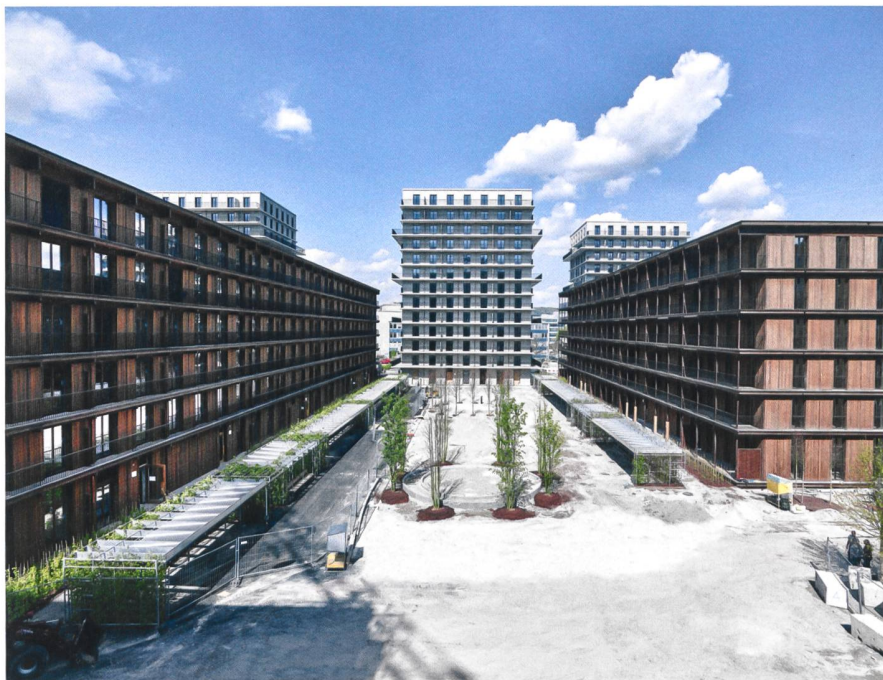
Die drei langen Wohnriegel aus Holz bilden einen Kontrast zu den benachbarten Betontürmen.

Die Firma Renggli hat sich in den letzten zwanzig Jahren intensiv mit dem Wohnungsbau auseinandergesetzt und dabei ein Vorgehen in verschiedenen Phasen entwickelt. Am Anfang steht immer eine präzise Analyse des jeweiligen Gebäudes oder der Siedlung. Wie sieht es baulich aus, stimmen die räumlichen Gegebenheiten noch, wie ist die Energieeffizienz? Daraus erarbeiten wir für die Bauherrschaft ein strategisches Konzept. Vielleicht lohnt es sich, eine Siedlung noch minimal zu restaurieren, so dass sie für eine Lebensdauer von weiteren zehn oder zwanzig Jahren funktioniert. Eine andere Variante ist, dass man das gesamte Grundstück mit einbezieht und eine innere Verdichtung mit Anbauten oder Aufstockungen vorsieht, kombiniert mit einer energetischen Sanierung der Gebäudehüllen. Als dritte Variante betrachtet man den Gesamtbestand und überlegt, wo man renovieren soll und wo ein Ersatz Sinn ergibt.