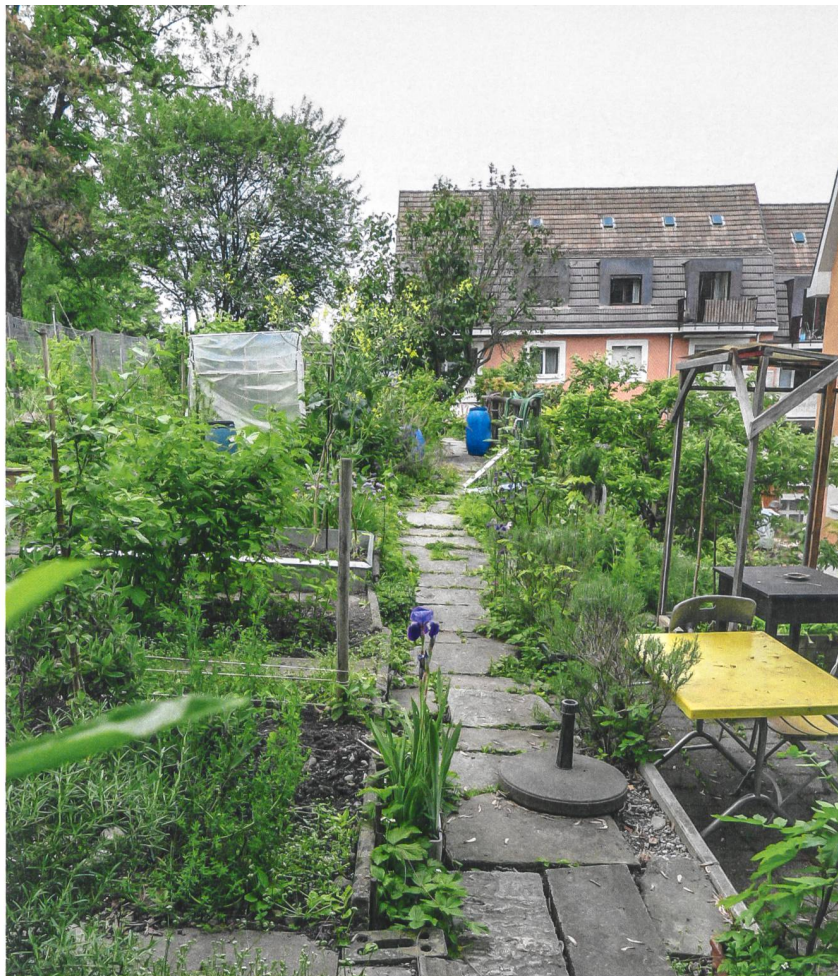
Die Nutzgärten an der Böschung über der Siedlung blieben erhalten.

Ein Kritikpunkt, der auch von einem Bewohner vor Ort eingebracht wird. Sonst aber gefalle ihm und seiner Familie die Neugestaltung. «Wir haben es nicht so mit Schickimicki. Wir fühlen uns wohler, wenn es ein bisschen natürlich ist.» Hier sind jedoch nicht ganz alle der gleichen Meinung. Als «schrecklich» bezeichnet eine ältere Bewohnerin das hoch gewachsene Gras auf Nachfrage. Und erzählt wenige Sätze später: «Gestern habe ich mir aber erlaubt, vor dem Haus ein paar «Margritli» für einen Blumenstrauss zu pflücken.» Etwas, was vor wenigen Jahren noch nicht möglich gewesen wäre. ■