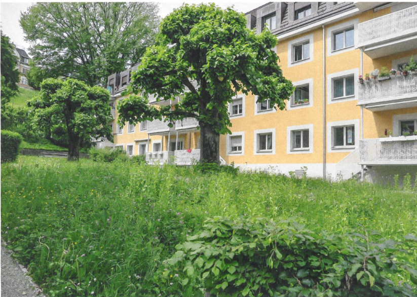
Eine grössere Rasenfläche zwischen den Gebäuden wurde zur Blumenwiese umgestaltet.