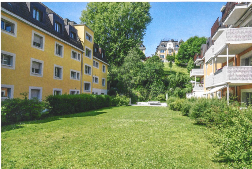
Sträucher kommen als «Abstandsgrün, das Abstand schafft» auch bei den Spielwiesen zum Einsatz und trennen die Sitzplätze vom gemeinschaftlichen Raum.