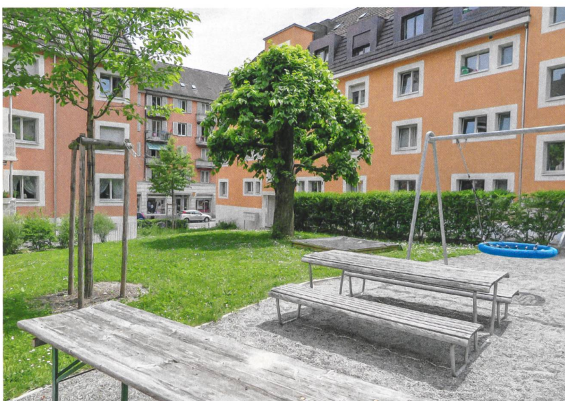
Die Kiesplätze waren ursprünglich Wäscheaufhängeplätze. Dank neuer Möblierung und Bepflanzung mit Schattenbäumen sind sie heute attraktive Aufenthaltsorte.