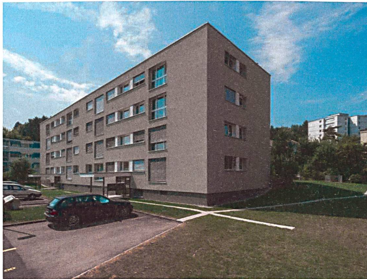
Gesamtsanierung MFH Am Brunnenbächli in Zollikerberg

Liegenschaftsanalysen Generalplanungen Bauleitungen