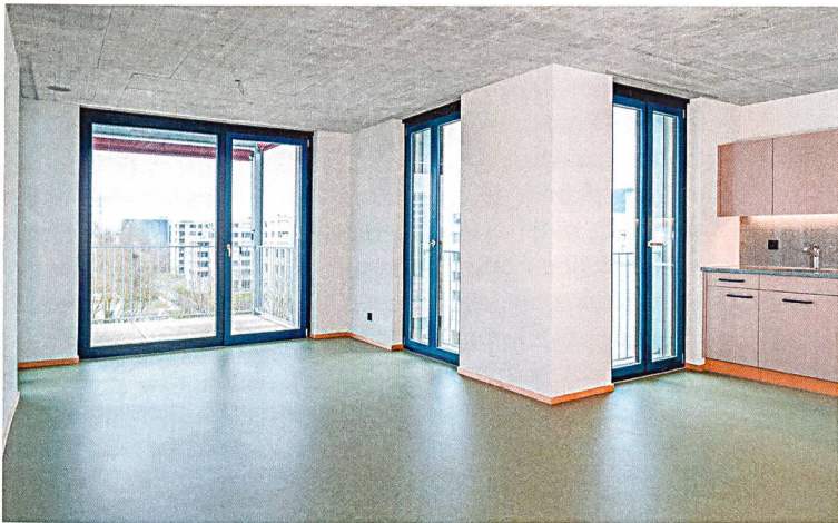
Die Farbgestaltung bei den Küchen und Linoleumböden sowie die Rohbetondecke prägen die neuen Alterswohnungen.

Siebzig günstige altersgerechte Wohnungen und eine Kindertagesstätte sind im März in Zürich Schwamendingen bezugsbereit geworden. Die Stiftung Alterswohnungen der Stadt Zürich (SAW) eröffnete die erste Etappe der Überbauung Helen Keller. Bis 2020 entstehen insgesamt 152 1 ½- bis 3-Zimmer-Wohnungen. Anstelle einer aufwändigen Sanierung der 1974 erstellten Altbauten entschied sich die Stiftung vor sechs Jahren für einen Neu-