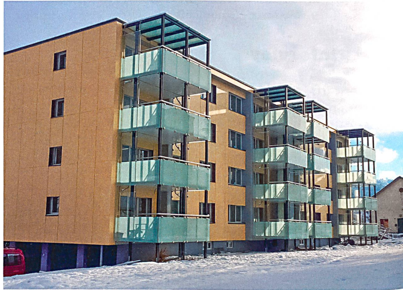
Die GdG hat in Wattwil (SG) ihre zweite Liegenschaft erworben.