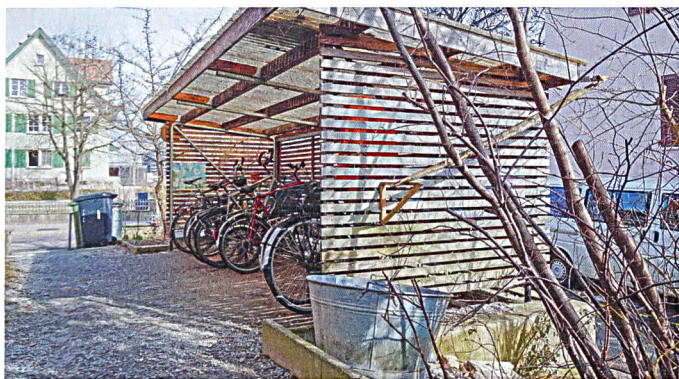
In gemeinschaftlicher Arbeit entstehen in Gesewo-Siedlungen auch Velounterstände im Freien.