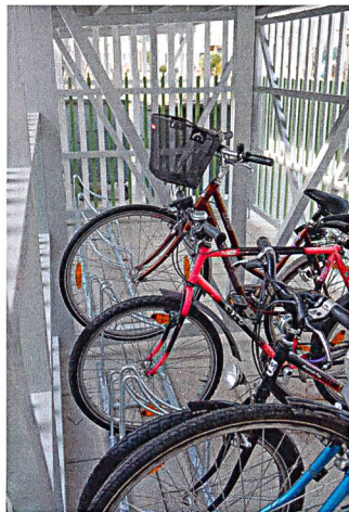
Wichtig für die GWG: Die Velohäuschen sollten überdacht und abschliessbar sein.