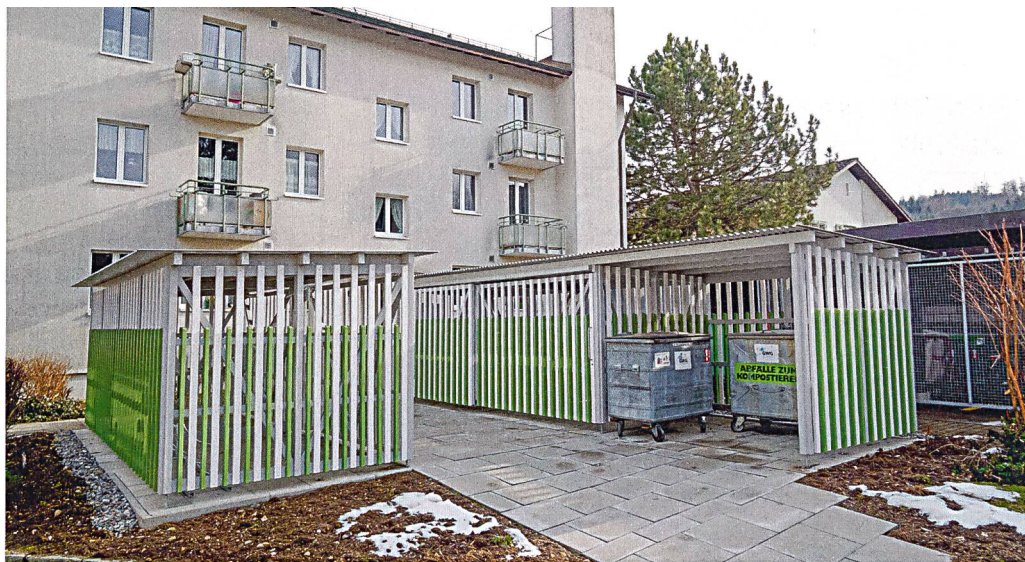
Bei der GWG liess man eigene Velohäuschen entwerfen, die nun in der ersten Siedlung im Einsatz sind.