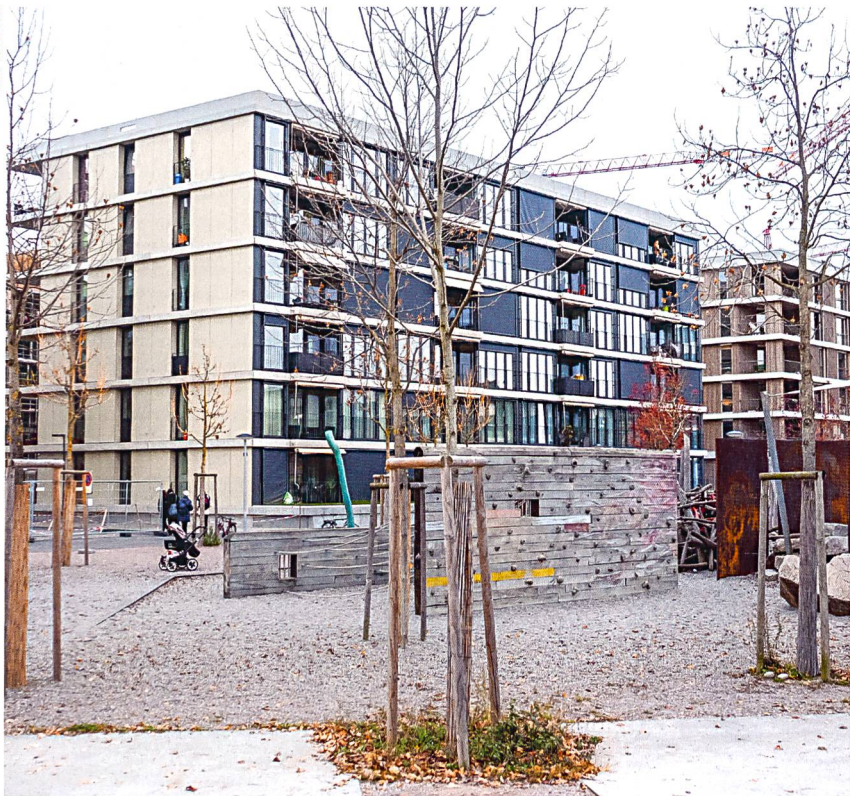
Auch das Haus der Sowag AG für sozialen Wohnungsbau ist auf die Anforderungen der 2000-Watt-Gesellschaft ausgerichtet. Während der Kern aus Beton besteht, sind die Aussenhüllen in einer mehrschichtigen Leichtbauweise ausgeführt. Treppen, Loggien, Balkone und Stützen wurden kostengünstig aus vorfabrizierten Elementen erstellt.