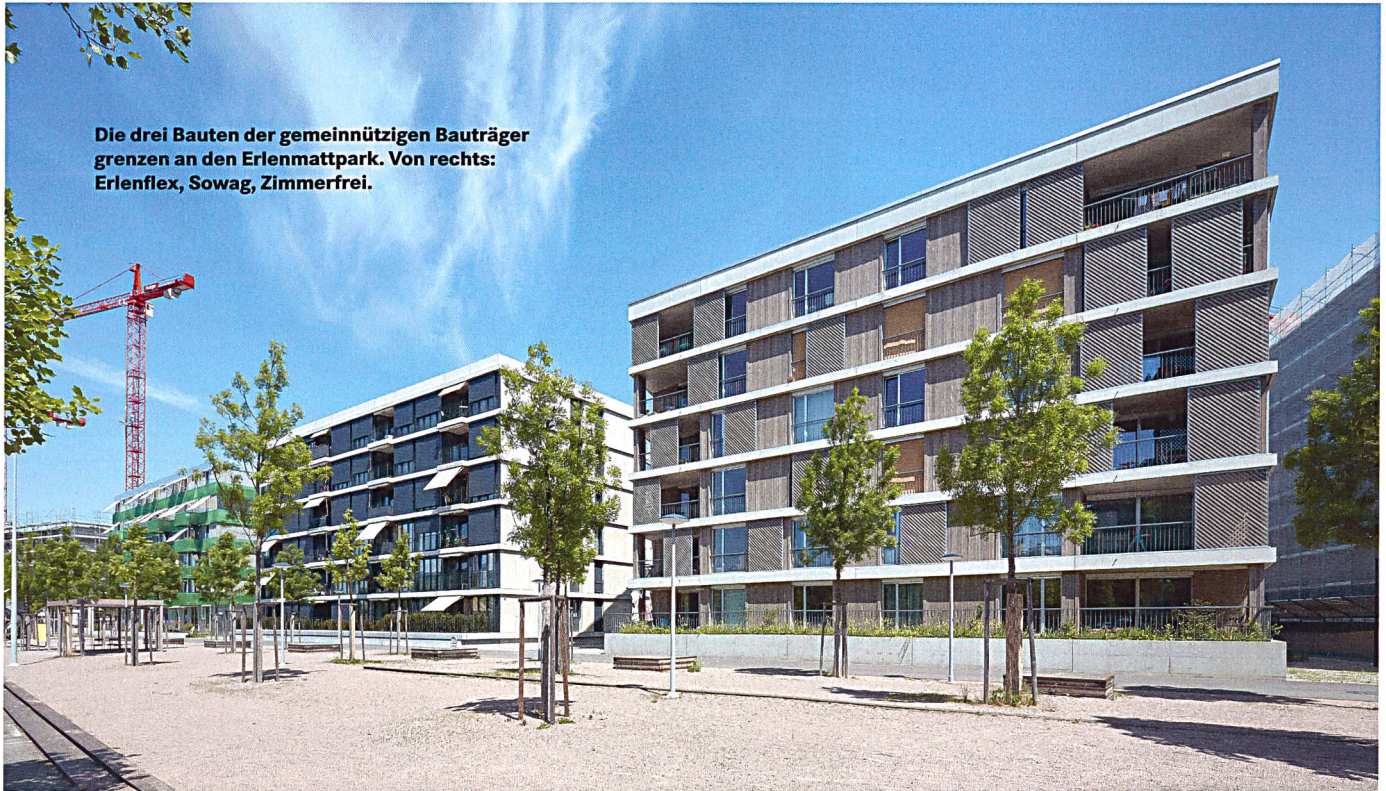
Die drei Bauten der gemeinnützigen Bauträger grenzen an den Erlenmattpark. Von rechts: Erlenflex, Sowag, Zimmerfrei.