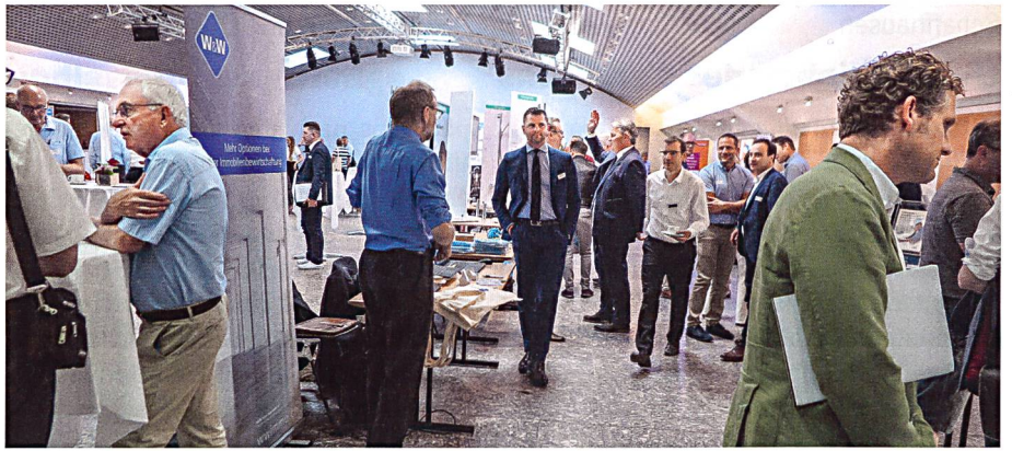
Der Marktplatz im Vorfeld der Zürcher GV bot Raum für Diskussion und Information.