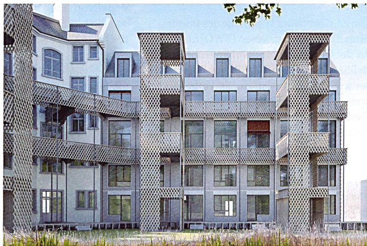
Das historische Eckhaus wird beidseitig mit Neubauten ergänzt, Laubengänge und eine Plattform schaffen Begegnungsräume.

Aus dem Wettbewerb gingen Wild Architekten aus Zürich als Sieger hervor. Sie erweitern das Haus Eber beidseitig und führen dabei die vorhandene Gebäude- und Dachvolumetrie fort. Die Wohneinheiten sind mehrheitlich als Maisonettes mit überhohen Wohn-/Essbereichen organisiert und trennen mit unterschiedlichen Ebenen geschickt die Gemeinschaftsräume von den Individualzimmern. Jedes zweite Geschoss wird über