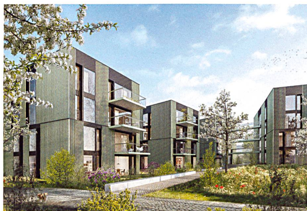
Auf dem südlichen Breiteliareal entstehen 35 neue Wohnungen.

Nach Siedlungen in Horgen, Küsnacht und Meilen baut die Baugenossenschaft Zurlinden in einer weiteren Zürcher Seegemeinde. Im August feierte die Unternehmergenossenschaft die Grundsteinlegung für eine neue Überbauung in Thalwil. Sie konnte dafür auf dem südlichen Teil des Areals Breiteli zu Marktpreisen Land im Baurecht erwerben. Nach Plänen der Zürcher Architektin Sara Spiro entstehen verteilt auf vier Häuser an der Alten Landstrasse 35 Wohnungen mit zweieinhalb bis viereinhalb Zimmern; sie ersetzen zwei gemeindeeigene Mehrfamilienhäuser mit 15 Wohnungen aus den 1920er-Jahren. Die neuen Wohnungen sind so konzipiert, dass sie sich sowohl für Familien als auch für Senioren gut eignen. Die Überbauung soll 2020 bezugsbereit sein.