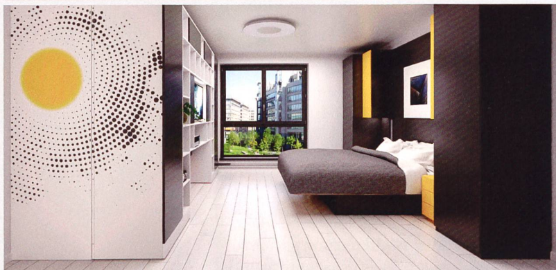
Das Wohnzimmer mit Schrankküche lässt sich durch Verschieben eines Elements in ein Schlafzimmer verwandeln.

Vernetzte Haustechnik wird nur ein Merkmal der smarten Wohnung der Zukunft sein. Wenn Wohnraum immer knapper und teurer wird, wie wir dies in den Grossstädten schon heute erleben, dann ist auch der Umgang mit der vorhandenen Fläche ein wichtiges Thema. Hier setzt die innovative kroatische Firma dizzconcept an. Sie hat nicht nur mobile Schrankküchen erfunden, sondern ein Möblierungskonzept, mit dem sich das Wohnzimmer in wenigen Minuten in ein Schlafzimmer verwandelt. Das System namens MOVI beruht auf einem beweglichen Schrank. Der rechte Schrankteil, der tagsüber Teil des Wohnzimmers ist, wird nachts auf die linke Seite geschoben, das Sofa verwandelt sich in ein bequemes Bett. Der Tagesteil umfasst eine voll ausgestattete Schrankküche,