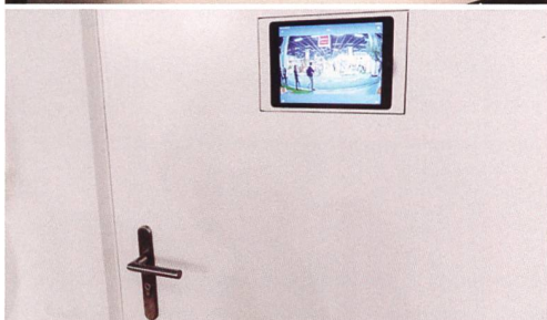
Die Türe lässt sich per Fingerprint oder aus der Ferne via App öffnen. Im Innern verfügt sie über ein Display mit allen Funktionen eines Tablets (unteres Bild).

eine Software, mit der bestimmten Personen Zugang gewährt werden kann. Diese Neuentwicklung ersetzt nicht nur den Milchkasten, sondern ist auch für Unternehmen gedacht, die damit den Zugang zu Geräten oder Dokumenten für ihre Angestellten organisieren – gerade dort, wo feste Arbeitsplätze nicht mehr die Regel sind ( www.xtobox.de ).