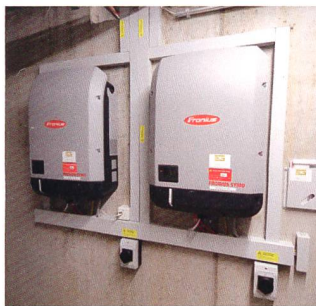
In der «Teiggi» sind auch die Photovoltaikanlage oder die Ladestationen für Elektrofahrzeuge ins Leitsystem eingebunden.

Wie das Beispiel «Teiggi» zeigt, kann die Fernwartung und Fernüberwachung der Gebäudetechnik helfen, um Betrieb und Unterhalt rationeller zu gestalten. Interessant ist dies unter dem Aspekt der «preventive maintenance», also des präventiven Unterhalts der Gewerke. Der Ansatz ist einfach: Statt zu warten, bis es Probleme gibt, und diese mit einer Reparatur zu beheben, setzt man schon im Frühstadium bei den Ursachen an. Damit ist eine zustandsorientierte Instandhaltung der Geräte und Anlagen möglich: Gehandelt wird, sobald es nötig ist, nicht nur nach starren Fahrplänen oder Inspektionsterminen.