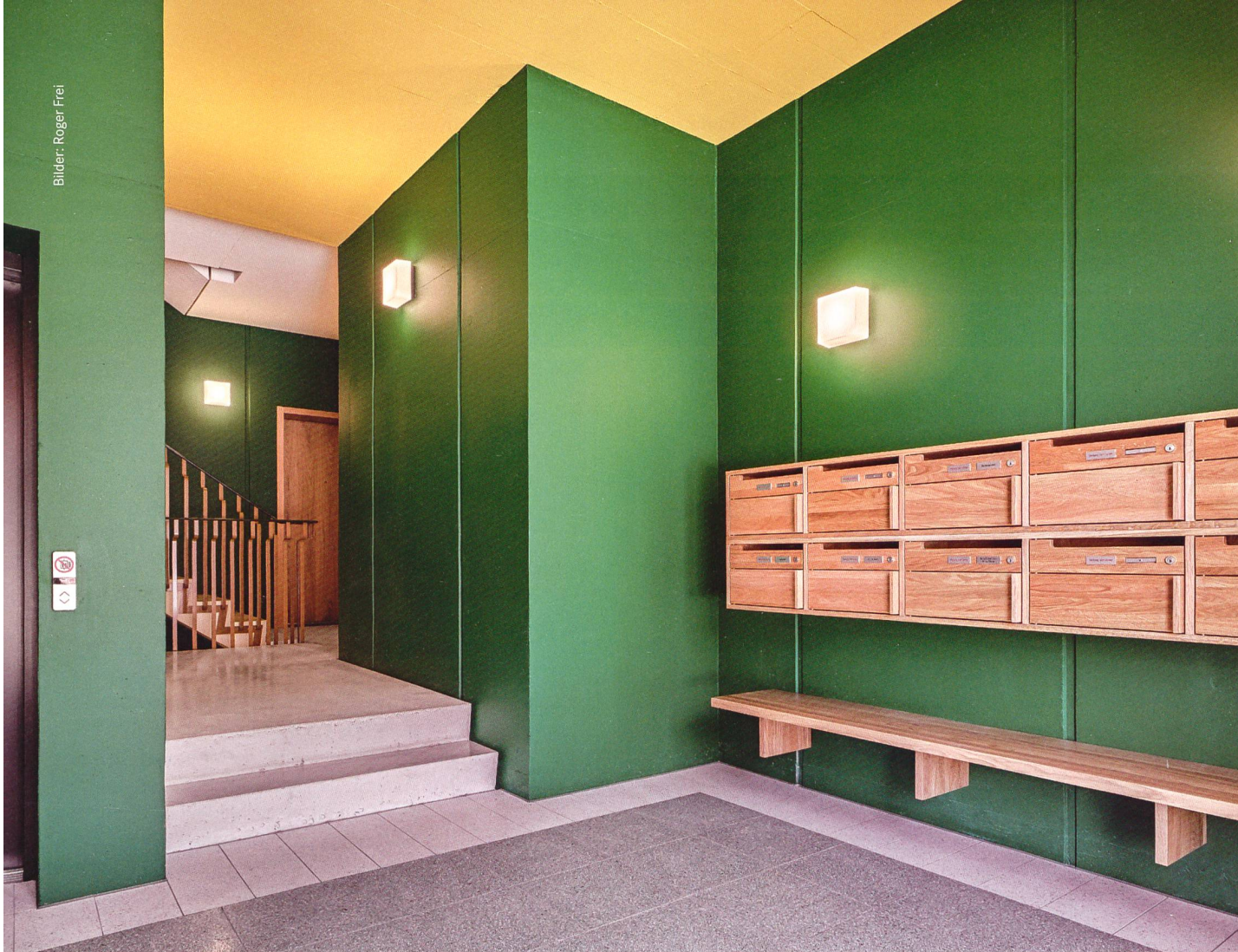
Die Wohnsiedlung Orenberg in Ossingen ist eine Neuinterpretation des typischen ländlichen Bauens im Zürcher Weinland. So findet sich im Treppenhaus das typische Grün der damals üblichen Kachelöfen.

Die Siedlung Orenberg – ein Beispiel für den Einsatz von Farbe im Innenraum