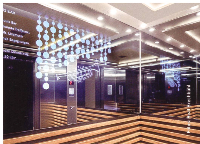
Durch den SmartMirror lässt sich die Zeit im Aufzug sinnvoll nutzen – man ist stets gut informiert.

«Der Bahnverkehr im Bahnhof Horgen Oberdorf ist beeinträchtigt. Schnellste Alternativroute nach Zug: S5 via Affoltern a.A.» Gestochen scharf steht die Information auf einer Aufzugstüre im Hauptbahnhof Zürich. Ein netzwerkfähiger Projektor bespielt die Aussenflächen von Aufzugstüren mit Informationen aller Art. Doch nicht nur das: Die Schindler DoorShow macht die Aufzugstür auch zur Kinoleinwand oder zum Stimmungsbild – je nachdem, was die Anlagebetreiber darauf projizieren wollen. «Dank der DoorShow können wir bestehende Flächen für Informationszwecke nutzen und müssen nicht zusätzliche Schilder oder Bildschirme aufstellen. Das reduziert nicht nur Kosten, sondern kommt auch der Architektur zugute», erklärt Bruno Lochbrunner, Leiter Konzeptionelles Bahnhofmanagement bei SBB Immobilien.