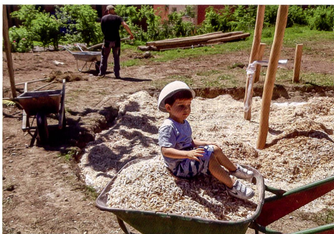
Grosse und kleine Bewohnende der Siedlung Pfaffenlebern in Rümlang (ZH) haben im Frühsommer gemeinsam Hand angelegt. Und wo nötig auch mal eine Pause eingelegt.