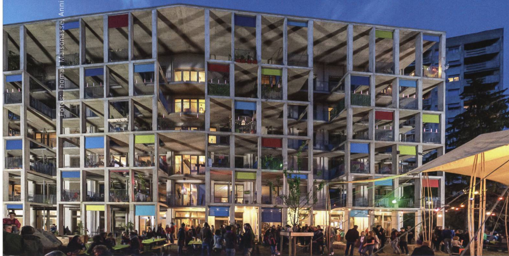
Beim Gebäude mit 38 Wohnungen in Soubeyran hat Equilibre gezeigt, dass Holz-Lehm-Bauten in diesem Massstab möglich sind. Im Garten wird mit einem natürlichen Filtersystem und der Hilfe vieler Regenwürmer das Abwasser aufbereitet.