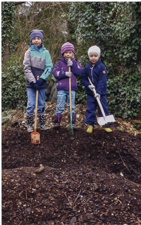
Siedlung Ilanzhof (BG Freiblick): Auch der Nachwuchs hilft beim Kompostschichten.