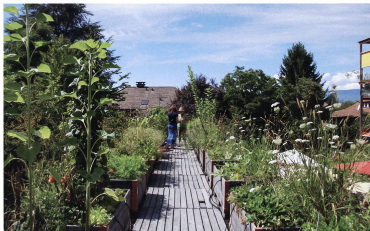
Gartentag in Cressy. Der Permakulturgarten gedeiht nicht zuletzt dank dem Kompost, der aus den Ausscheidungen der Bewohnenden gewonnen wird.