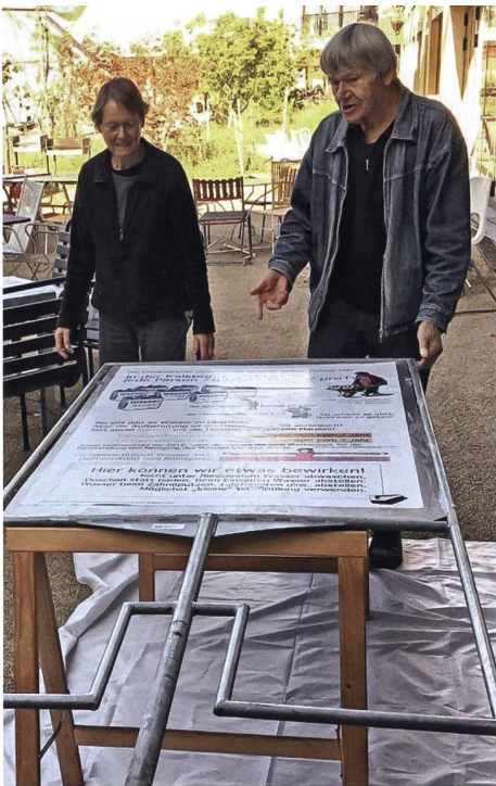
Plakataktion der Gruppe «Leicht leben» in der Kalkbreite.