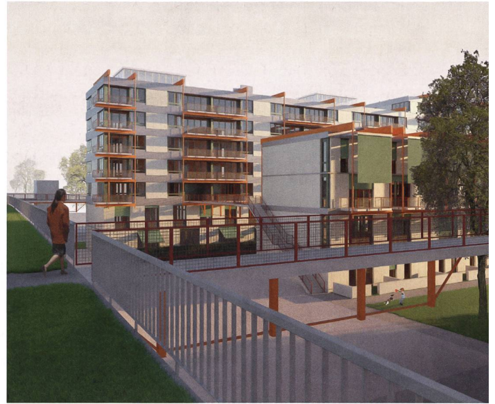
Das Siegerprojekt von BS+EMI schliesst an den Hochpark an. Brücken schaffen Verbindungen zu diesem und zwischen den Häusern, ausserdem ist ein zentraler Gemeinschaftshof mit Bäumen vorgesehen.

Mit der Einhausung eines fast einen Kilometer langen Autobahnstücks in Zürich Schwamendingen, die derzeit im Bau ist (siehe Wohnen 5/2021), wird sich das ganze Quartier völlig verändern. Auch die 1942 gegründete Baugenossenschaft Glattal Zürich (BGZ), die mit 2120 Wohneinheiten zu den grössten Genossenschaften der Stadt gehört, muss ihre Überbauung Neuwiesen I-III ersetzen. Sie hat deshalb das Amt für Hochbauten der Stadt Zürich mit einem Architekturwettbewerb im selektiven Verfahren mit zehn geladenen Teams betraut, der kürzlich entschieden wurde. Die zwischen 1949 und 1985 in Etappen erstellten Wohnbauten grenzen direkt an den künftigen Überlandpark, der auf der Einhausung Schwamendingen in sieben Metern Höhe entsteht. Durch seine zentrale Lage, direkt an der Unterführung und am Aufgang Saaten sowie in unmittelbarer Nähe des künftigen Überlandparkpavillons, kommt dem Areal eine Schlüsselrolle zu. Die bestehenden 125 mehrheitlich kleinen Wohnungen sollen bis 2026 durch eine zeitgemässe Wohnsiedlung ersetzt werden, die den veränderten Wohnbedürfnissen und Nachhaltigkeitsaspekten Rechnung trägt.