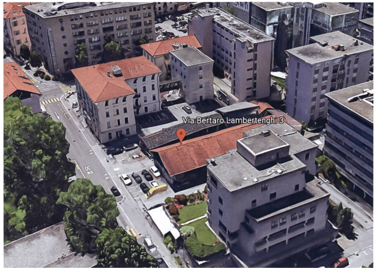
Mitten in Lugano will die Cooperativa Vivere Lambertenghi ein Mehrgenerationenprojekt realisieren. Den Zuschlag für das Baurecht hat sie bereits erhalten.

Im Tessin, nicht eben ein Hotspot genossenschaftlichen Wohnens, tut sich etwas: Die im Oktober auf Initiative der Gewerkschaft Ocst, des Vereins GenerazionePiù und von Privatpersonen eigens gegründete «Cooperativa Vivere Lambertenghi» hat den Zuschlag für ein Baurecht erhalten, das die Stadt Lugano in einem Wettbewerb ausgeschrieben hatte. Dieses befindet sich mitten in der Stadt und in Seenähe. An der Via Bertaro Lambertenghi 3, wo aktuell eine alte Lagerhalle steht, soll ein Mehrgenerationenwohnprojekt entstehen, das im Südkanton seinesgleichen sucht: 25 Wohnungen zu moderaten Preisen sind vorgesehen, zudem Räume für Gewerbe und Kunsthandwerk, ein Tageszentrum für ältere Menschen, eine Bar, eine Gärtnerei und ein Gemeinschaftsgarten, der dem Quartier offensteht. Auch ökologisch und energetisch wird ein hoher Standard angestrebt. Bevor ein Architekturwettbewerb ausgeschrieben werden kann, muss allerdings zuerst noch das Stadtparlament dem Projekt grünes Licht erteilen.