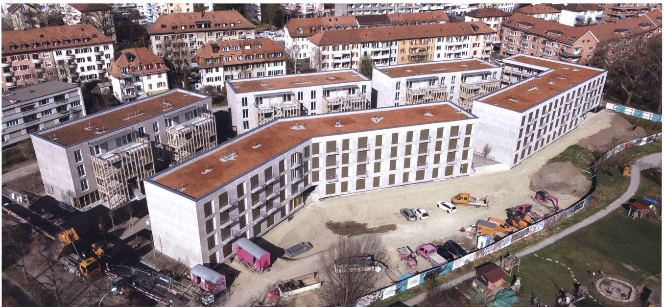
Die fünf Gebäude der Huebergass sind dicht gebaut und bilden zusammen eine innenhofartige Gasse.

«Das hat sich aber aus der Wohnungsausschreibung ergeben. Hier wurde klar, dass der private Raum begrenzt ist, man sich in der Huebergass unweigerlich immer begegnet und ein enger Austausch unumgänglich wird.» Entsprechend hätte sich schon während der Bauphase gut ein Drittel der Mitglieder in Arbeitsgruppen oder Kommissionen eingebracht. Trotzdem sei der Alltag dann nochmals etwas anderes gewesen. Im Mai 2021 war offizieller Bezug der Wohnungen. «Wir waren sogar schon einen Monat früher parat, auch das Budget konnte dank fixem Werkpreis und einer soliden Werk- und Finanzplanung gut eingehalten werden», freut sich Zaugg. Die wirkliche Genossenschaftsarbeit aber begann erst jetzt. Während Verwaltung, Hauswartung und Treuhand extern organisiert sind, liegt alles andere an den Bewohnenden, die mit dem Einzug auch ihr Stimmrecht erhielten. Bilateral, am monatlich abgehaltenen «Hueberforum» oder über eine digitale Plattform musste man sich nun über gemeinsam genutzte Balkone, das Wegräumen von Spielgeräten oder die Gestaltung des Gartens einigen. «Aber es funktioniert, inzwischen engagieren sich über vierzig Prozent der Bewohnenden in irgendeiner Form für die Genossenschaft, das Quartier lebt. Das stimmt auch für die nächsten Schritte optimistisch», so der Geschäftsführer.