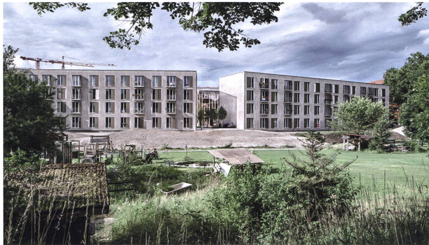
Die Huebergass-Überbauung ist auf einem Schrebergartenareal entstanden. Ab 2022 realisiert die Stadt gleich angrenzend einen Park.

WBG Huebergass, unterschrieb den Totalunternehmensvertrag mit der Halter AG und brachte 20 Prozent Eigenkapital ein, rund 80 Prozent sind fremdfinanziert.