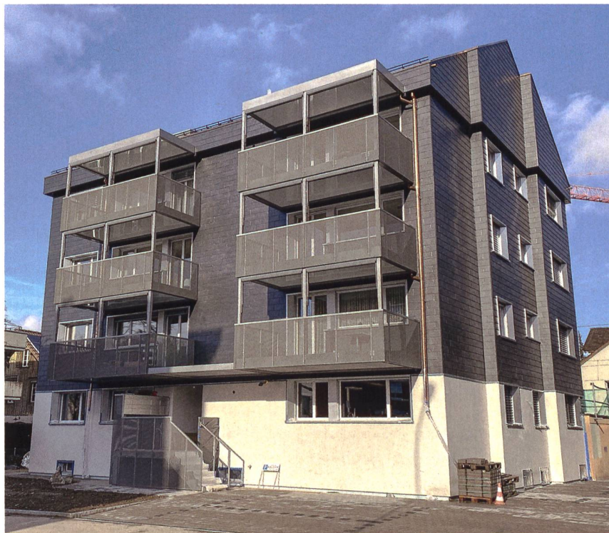
Das Mehrfamilienhaus der Wohnbaugenossenschaft Gewo Zürich-Ost in Uster zählt zu den ersten Sanierungsprojekten, die vom FdR-Sonderprogramm profitiert haben (Details siehe Folgeseite). Unter anderem erhielt es eine vorgehängte hinterlüftete Fassade.

FdR-Sonderprogramm unterstützt energetische Erneuerungsprojekte