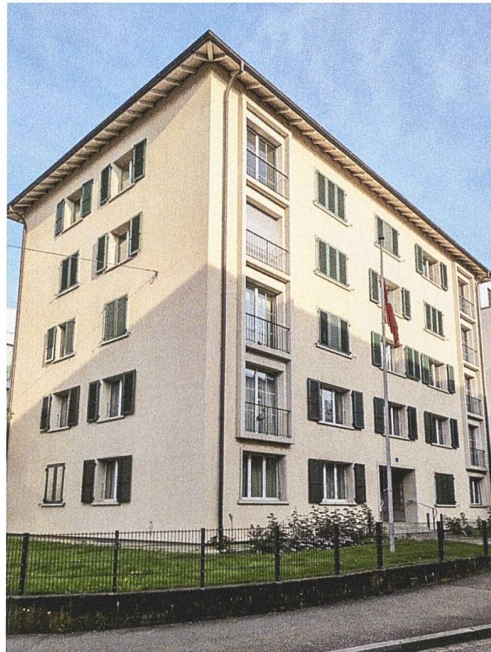
Die Wohngenossenschaft Redingbrücke wurde 1951 gegründet und besitzt in Basel drei Siedlungen. Sie setzte jahrelang auf Festhypotheken bei ihrer Hausbank. Nach einer Neuausschreibung konnte sie die Zinskosten deutlich senken.

möglichst optimalen Diversifikation sei es für gemeinnützige Bauträger ausserdem von Vorteil, die verschiedenen Förderinstrumente einzubeziehen. Dazu gehören die Emissionszentrale für gemeinnützige Wohnbauträger (EGW), der Fonds de Roulement und der Solidaritätsfonds des Dachverbands.