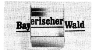
... und auf bayerisch

Besonderen „Mut“ bewies der Freiburger Herder-Verlag, der der unveränderten Stammausgabe seines Hauptschulbuches Physik/Chemie lediglich 16 Seiten – entsprechend dem neuen baden-württembergischen Lehrplan für die 6. Klasse – vorsetzte und das Ganze dann „Ausgabe Baden-Württemberg“ nannte.