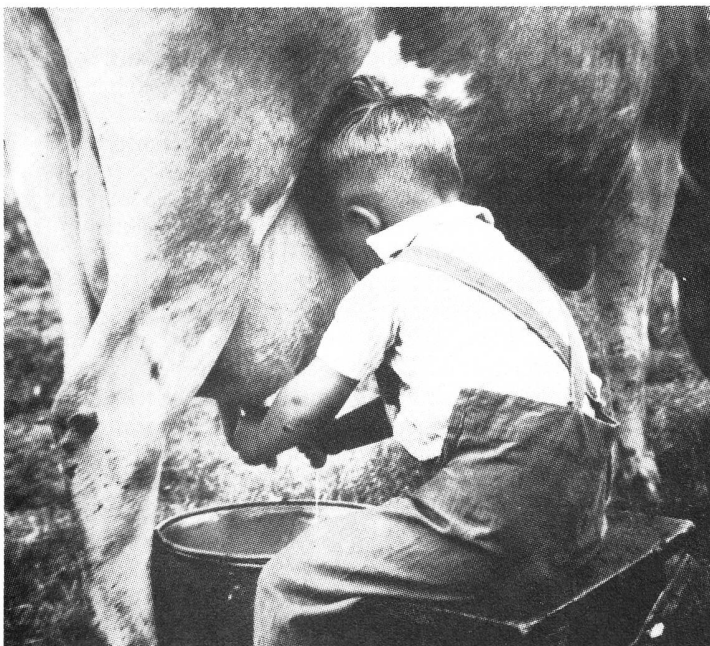
... oder so?

Die Finanzierung der Arbeit von FORBIT läuft bis Ende 1982 noch hauptsächlich über ein Forschungsprojekt mit der Universität. Die Übereinstimmung zwischen der Thematik des Forschungsprojektes und Vorstellungen und Praxis des Kollektivs war allerdings wesentliches Kriterium für diese Art der Finanzierung. Langfristig hoffen die FORBIT-Leute, daß sich ihre Arbeit durch Sachverständigen- und Gutachtertätigkeiten selbst tragen wird.