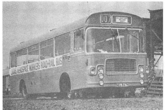
Straßen-Schienen-Bus der Lucas-Arbeiter