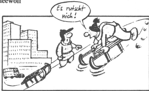
„Dann kann's nur dran liegen, daß hier kein Granulat gestreut ist!“