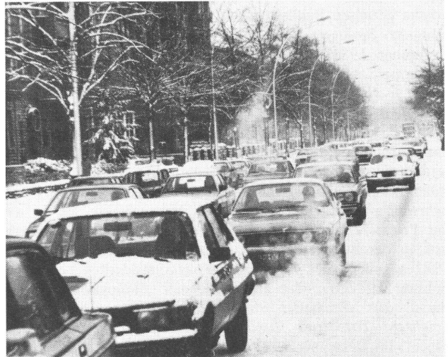
Zwischen diesen beiden Fotos liegen 24 Stunden. Noch am Mittwoch hatten sich die Autoschlängen über den vereisten Hohenzollerndamm gequält (oben). In der Nacht zu Donnerstag wurde Salz gestreut. Deshalb hatten die Autos gestern auf dem Kudamm (unten) wieder freie Fahrt.

Aus den wenigen Beispielen wird wohl ersichtlich, wie undramatisch von Polizei und Presse Tage gesehen werden, die zwar außerordentlich viele Verunglückte fordern, ansonsten aber den Individualverkehr ungehindert rollen lassen. Auch hohe Sachschadenzahlen schrecken nicht und werden, wie die Zahl der Verunglückten, erst gar nicht registriert. Ganz anders an den Tagen mit Winterglätte. Hier hat die Polizeipressestelle die von ihr registrierten genauen Unfallzahlen auf Abruf parat, die Presse kann sich bedienen, und tut dies meist korrekt, von den Boulevardzeitungen abgesehen, die die Polizeizahlen je nach Stimmung mit einem Chaos-Faktor zwischen zwei und drei multiplizieren. Tage mit Winterglätte sind die einzigen im