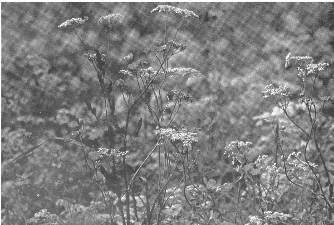
Die Gewerkschaft wieder zu einer blühenden Blumenwiese machen

AK: Die Stärke des Arbeitskreises liegt im Weiterspinnen und Entwickeln eigener Ideen. Es ist genau das, was du sagst mit der Wiese und den Blumen, die darauf wachsen. Es ist in der Tat so, daß die Gewerkschaftsarbeit eine ziemlich trockene Sache ist und alles sehr gefiltert abläuft. Sich da einzubringen ist schon sehr schwierig. Wir haben hier die Möglichkeit, mit Leuten zu diskutieren, die relativ gleichartige Erfahrungen machen und ähnlich denken. Die das Bedürfnis haben, die Entwicklung der Technik kritisch zu hinterfragen, eigene Vorstellungen zu entwickeln, und versuchen, herauszubekommen und offenzulegen, was verschwiegen oder vertuscht wird.