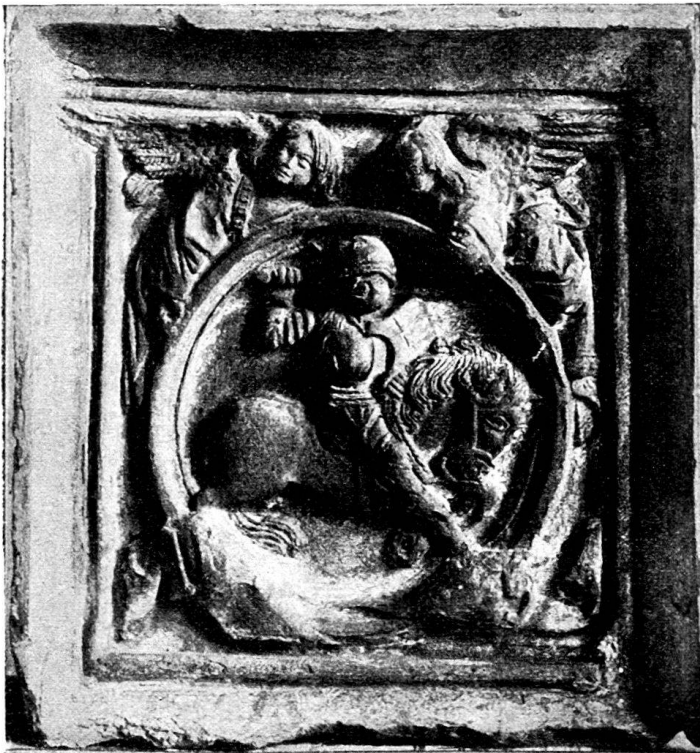
Fig. 5. Ofenkachel mit St. Georg.

Im September 1899 wurden bei Renovierung eines alten Hauses an der Bärengasse zu Stein am Rhein eine Anzahl von Ofenkacheln und Kachelmodellen aufgefunden, welche sich denjenigen anreihen, die vor 11 Jahren bei Fundamentierung des dortigen neuen Zollhauses ausgegraben wurden, und jetzt im Schweizerischen Landesmuseum aufbewahrt sind. Der neue Fund ist für die Sammlung des Histor.-antiquarischen Vereins von Stein erworben worden. Von den jetzt aufgefundenen Kacheln verdienen folgende Stücke Erwähnung.