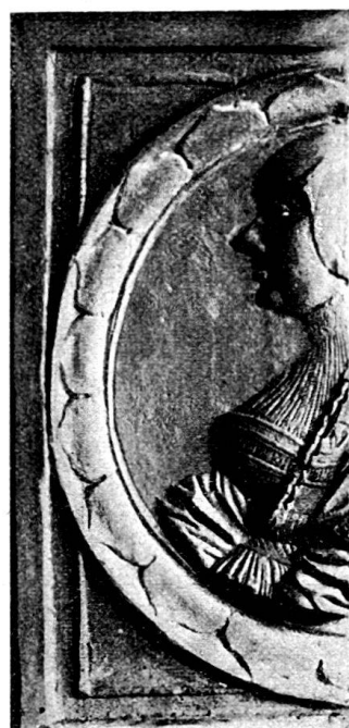
Fig. 7. Halbe Ofenkachel mit Frauenbildnis.

7. Das 7. Model, (Fig. 8) wieder eine ganze Kachel, ist 16 cm breit und 22 cm hoch. Innerhalb des 2 cm breiten Randes mit Hohlkehle befindet sich die Gestalt eines den Bogen spannenden unbekleideten bartlosen Mannes, wohl Apollon. Der Köcher hängt an der Linken, an einem schärpenähnlichen Bande mit flatternder, die Blöße deckender Schleife. Der nackte Körper zeigt trefflich modellierte Muskulatur, welche umsomehr hervortritt, als sich der Körper etwas zurückneigt, um den erhobenen Bogen zu spannen. Die fliegenden Locken des Gottes werden durch einen Lorbeerkranz zusammengehalten; sein Kopf ist im Verhältnis zu gross geraten, die