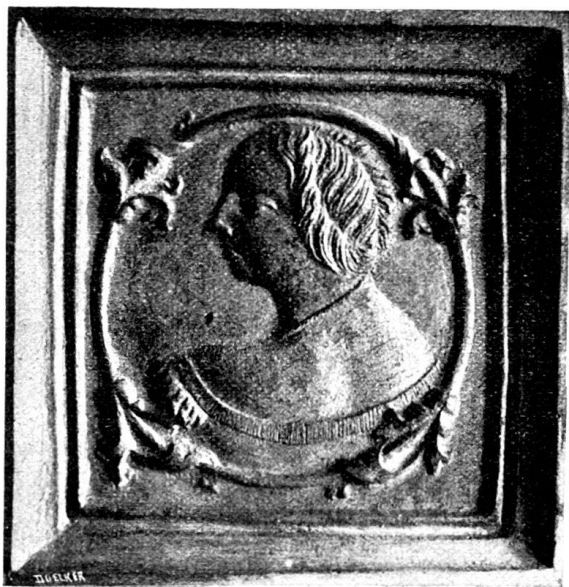
Fig. 6. Ofenkachel mit Frauenbildnis.

Bekleidet ist er mit dem einfachen Leibrocke des XV. Jahrhunderts und dem durch eine grosse Agraffe zusammengehaltenen Mantel. Den Kopf bedeckt turbanartig eine anliegende Kappe mit wulstförmiger Zindelbinde. Der Fürst steckt drei Finger der Rechten in den Schlitz des Wamses, die Linke ruht auf der Brüstung. Um einen Stab geschlungenes Laubwerk, aus welchem in der Mitte eine Maske hervorschaut, füllt das untere Feld dieser letztern. Ein ähnliches Model wurde schon beim Zollhause gefunden.