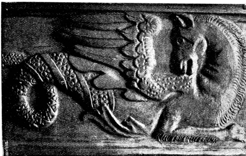
Fig. 9. Ofenkachel mit Hyppocamp.

Es liegt nun die Frage nahe, ob diese Model in Stein angefertigt worden sind oder ob vielmehr in grösseren Städten, den eigentlichen Kunstcentren, Kachelmodelle in Holz geschnitten wurden, über welche man die Model formte und als Handelsartikel an die Töpfer des ganzen Reichs oder gewisser Landesteile verkaufte, so dass der örtliche Handwerker nur noch Abdruck des Models, die Glasur und den Aufbau des Ofens zu besorgen hatte. Sehr vieles spricht dafür. Wenn die Model in Stein selbst angefertigt worden wären, so würde dies für eine hohe Stufe des Kunsthandwerkes an diesem kleinen Orte sprechen. Ich möchte diese Frage nicht beantworten; so lange man indessen nicht andernorts gefundene übereinstimmende Kacheln und Model nachweisen kann, nehme ich doch an, dass vorliegende Model Arbeiten einheimischer Kunsthandwerker sind, umsomehr als der viele Lehm, welcher bei Stein a. Rhein vorgefunden wird, den Bestand grösserer Töpfereien im Städtchen wahrscheinlich macht.