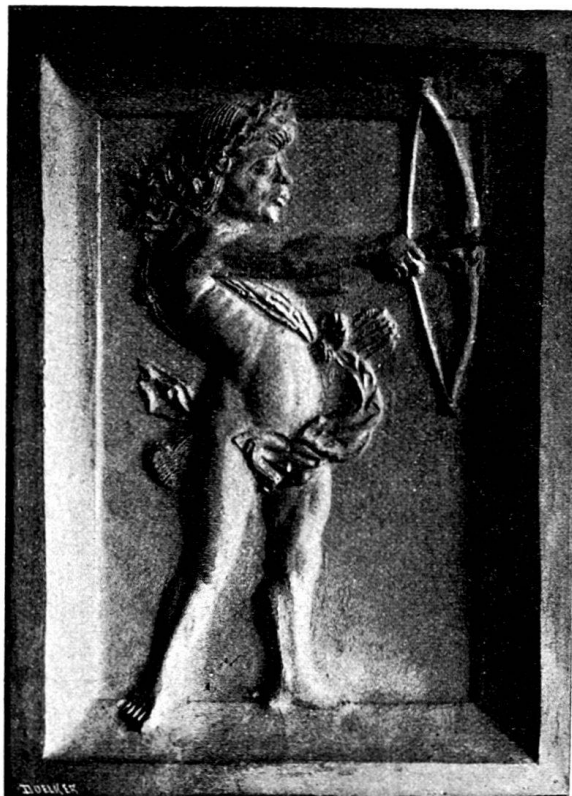
Fig. 8. Ofenkachel mit Schütze.

8. Erfreulicher sind die Gesichter der nackten Knaben, welche auf Model 8 (Taf. II, d) zur Darstellung gebracht werden. Zwei längliche, über-eck aufeinander geschichtete Quader füllen den Rahmen der Kachel. Die Langseiten beider Steine zeigen je eine rundliche Vertiefung, die Schmalseiten Löwenköpfe mit Ringen, an welchen sich die beiden gesunden dicken Jungen zu schaffen machen. Der Knabe unten links hat sich hiezu, unter den obern Quader geduckt, auf das rechte Knie niedergelassen; der andere Knabe oben links sitzt vergnügt rittlings über den obern Quader. Die ganze Kachel ist fein gedacht und gut durchgeführt.