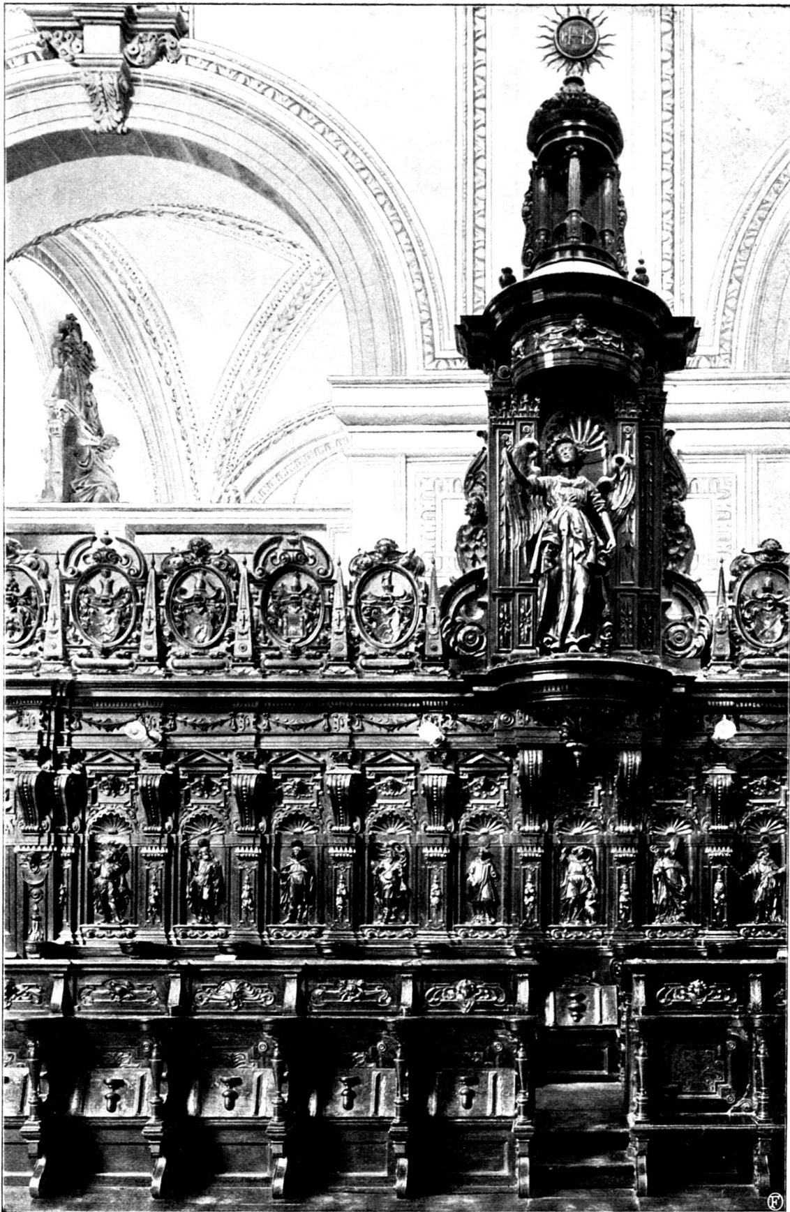
Teil des Chorgestühls der Hofkirche in Luzern.