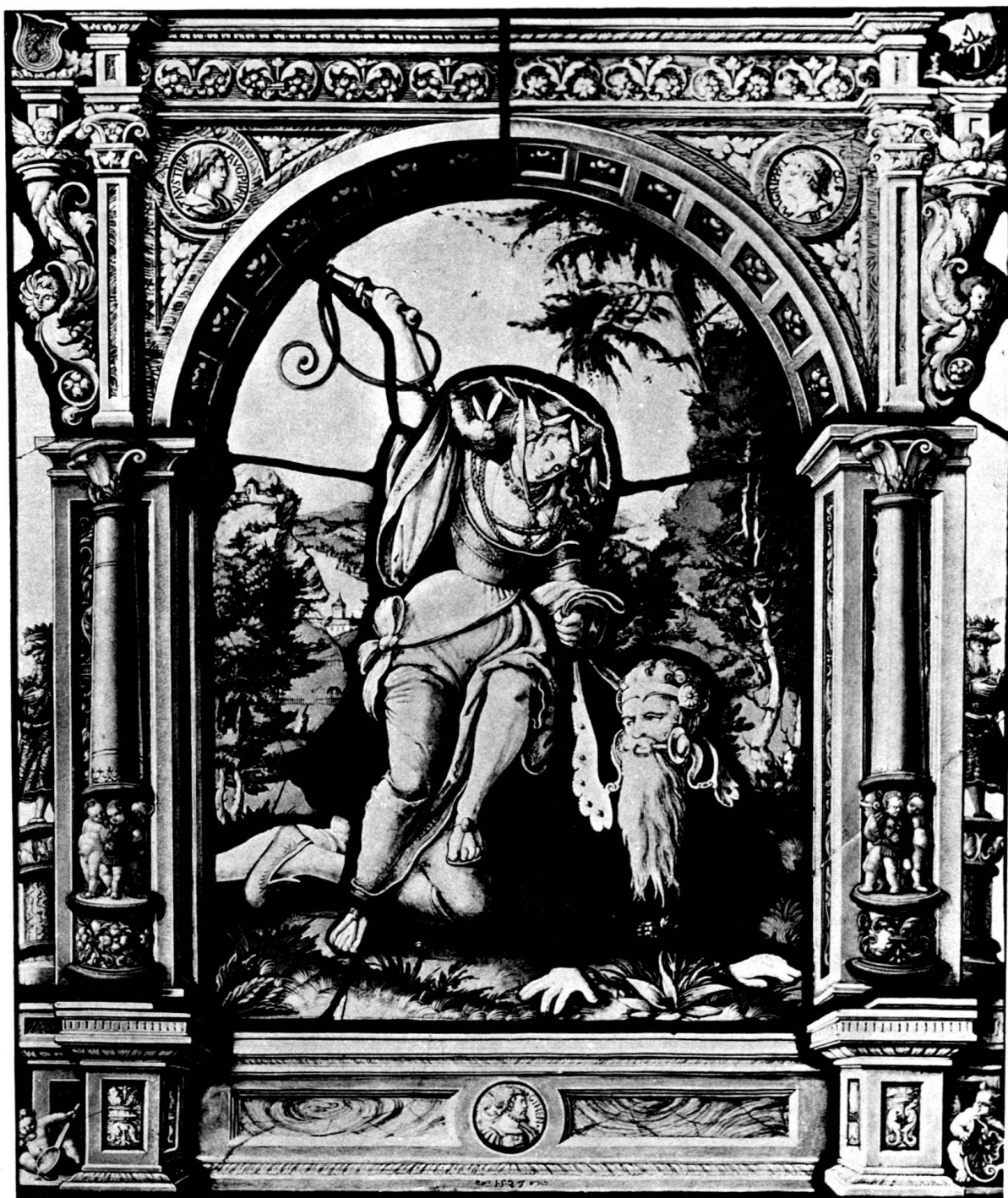
Glasgemälde von 1527 mit Darstellung des Aristoteles und der Phyllis.