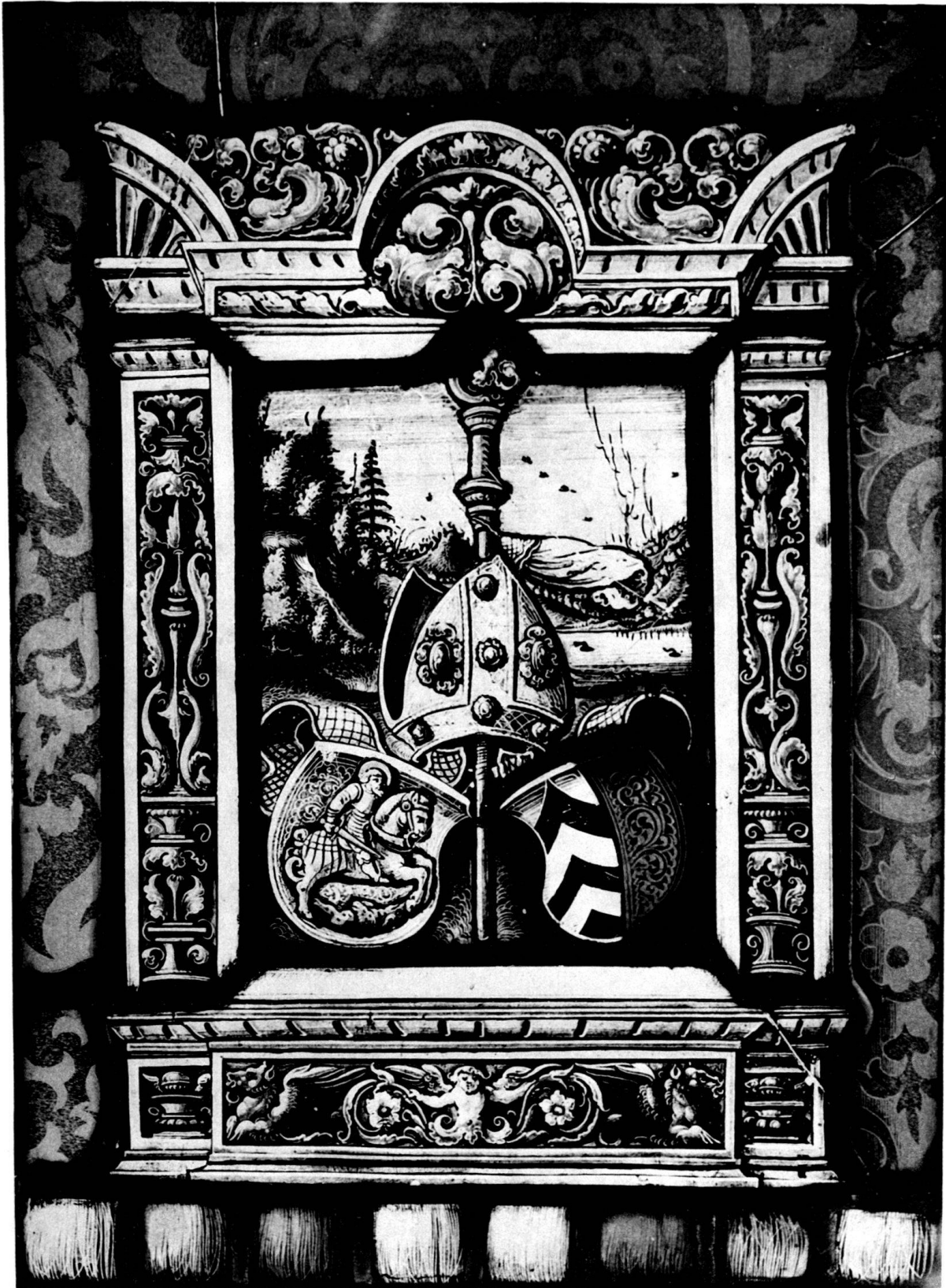
Wappenscheibe des Abtes David von Winkelsheim von St. Georg zu Stein a./Rh. (1499–1526).