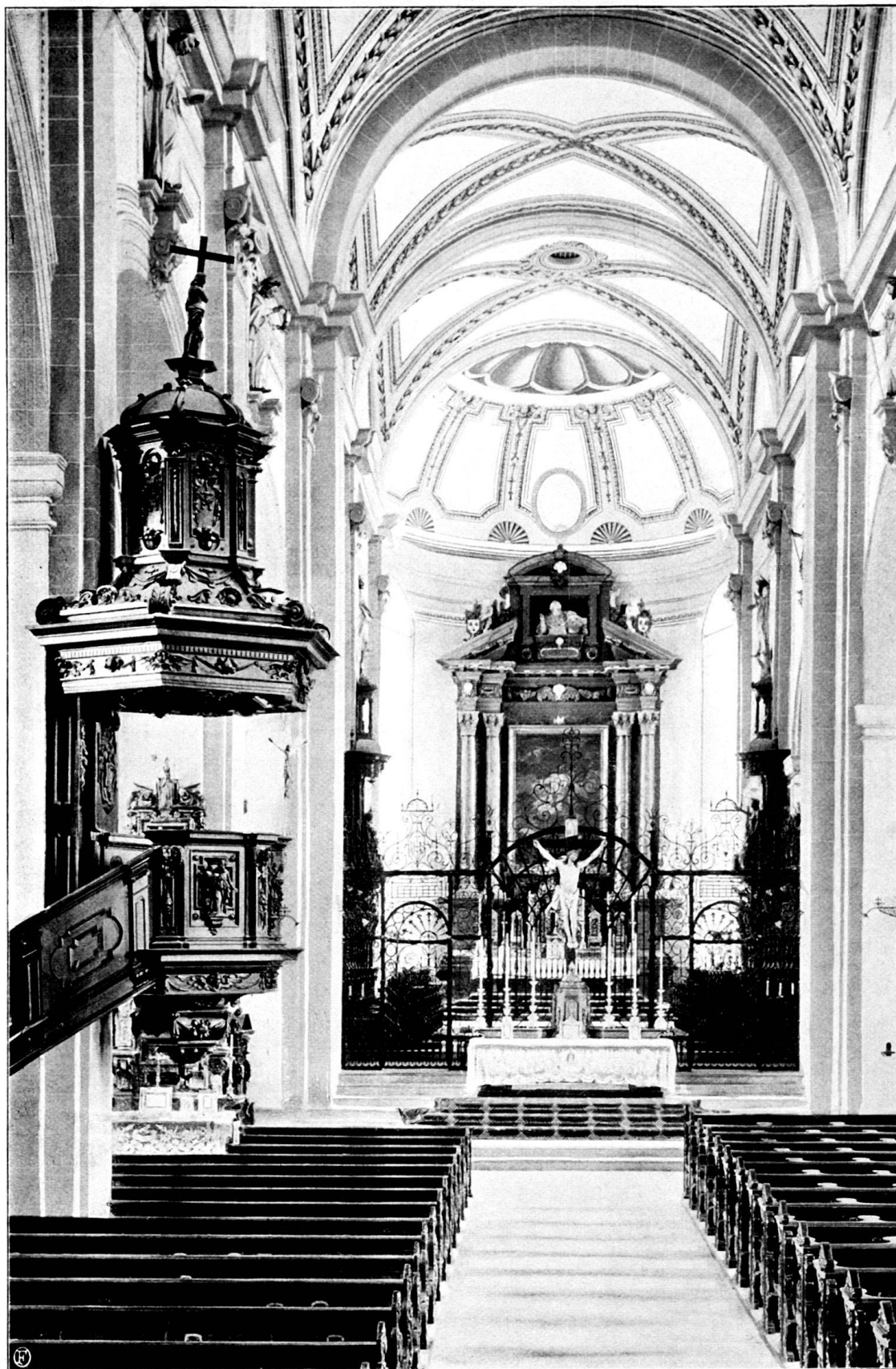
Kanzel in der Hofkirche zu Luzern mit Ausblick in den Chor.