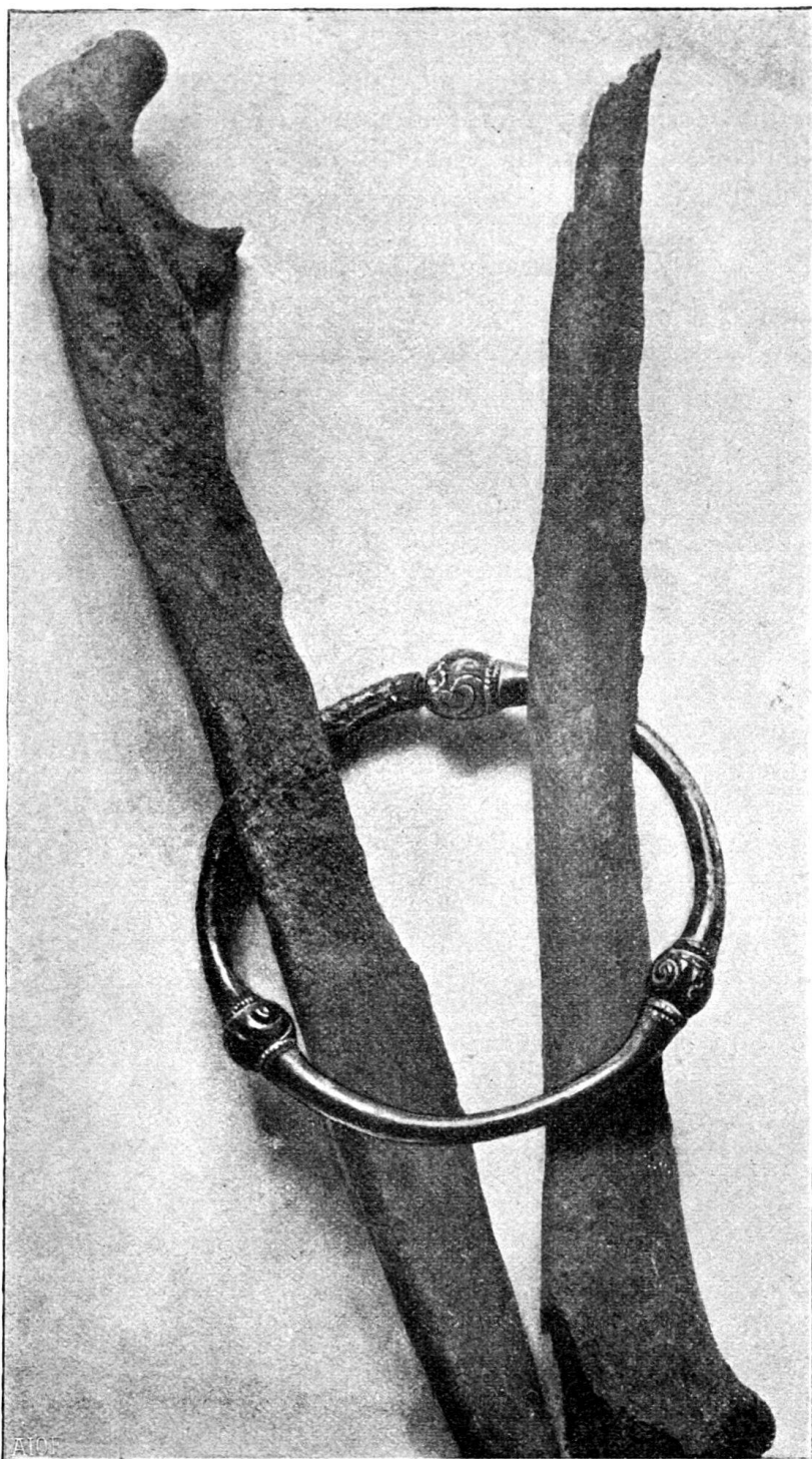
Fig. 65. Sépulture N° 12. — 25. février 1898.