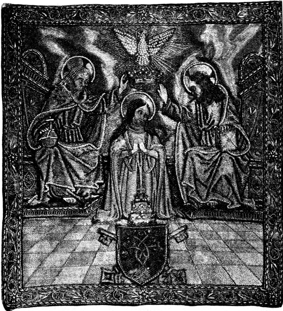
Fig. 122. Italiänische Stickerei von 1512

Die Stadtbibliothek Zürich bewahrte vier Exemplare dieser Stickereien. Zwei derselben sind mit dem Wappen des Papstes Giulio delle Rovere und der Jahreszahl 1512 versehen, (Fig. 122) offenbar die von Julius selbst geschenkten, beidseitig am Panner zu befestigenden Stücke. Die beiden andern zeigen