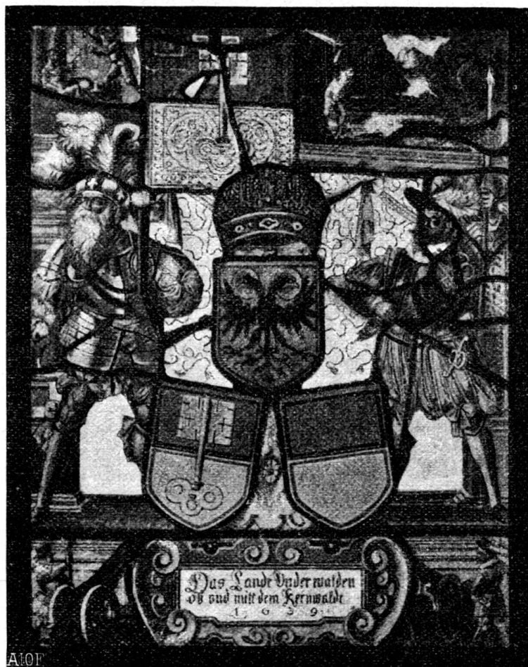
Fig. 130: Standesscheibe von Unterwalden.