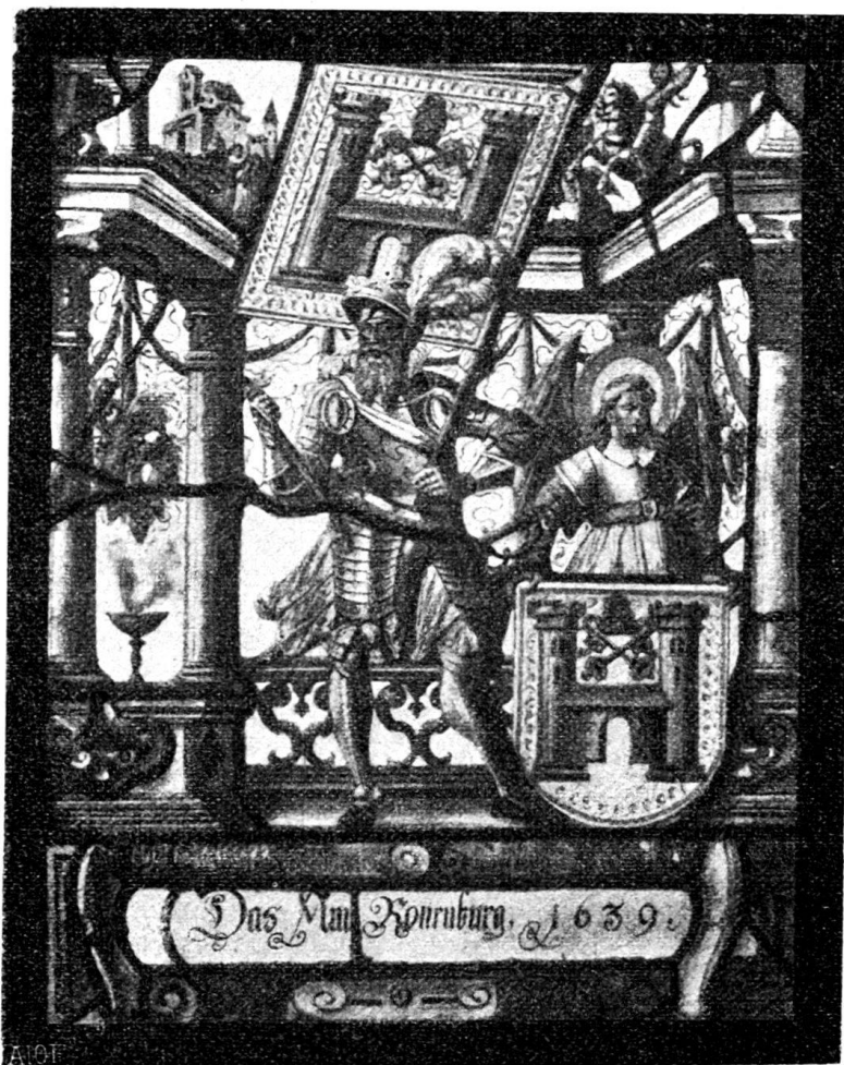
Fig. 127. Amtsscheibe von Rothenburg.

Zwischen dem geharnischten Pannerträger, der mit Streitkolben, Schwert mit Säbelgriff und Schweizerdolch bewaffnet ist, und einem Hellebardier in Panzerhemd und Ban-