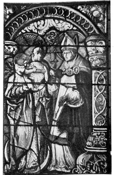
Kabinetscheiben von Chorherren und geistlichen Stiften im Kirchenchore zu Zofingen.