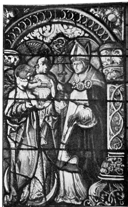
Kabinetscheiben von Chorherren und geistlichen Stiften im Kirchenchore zu Zofingen.