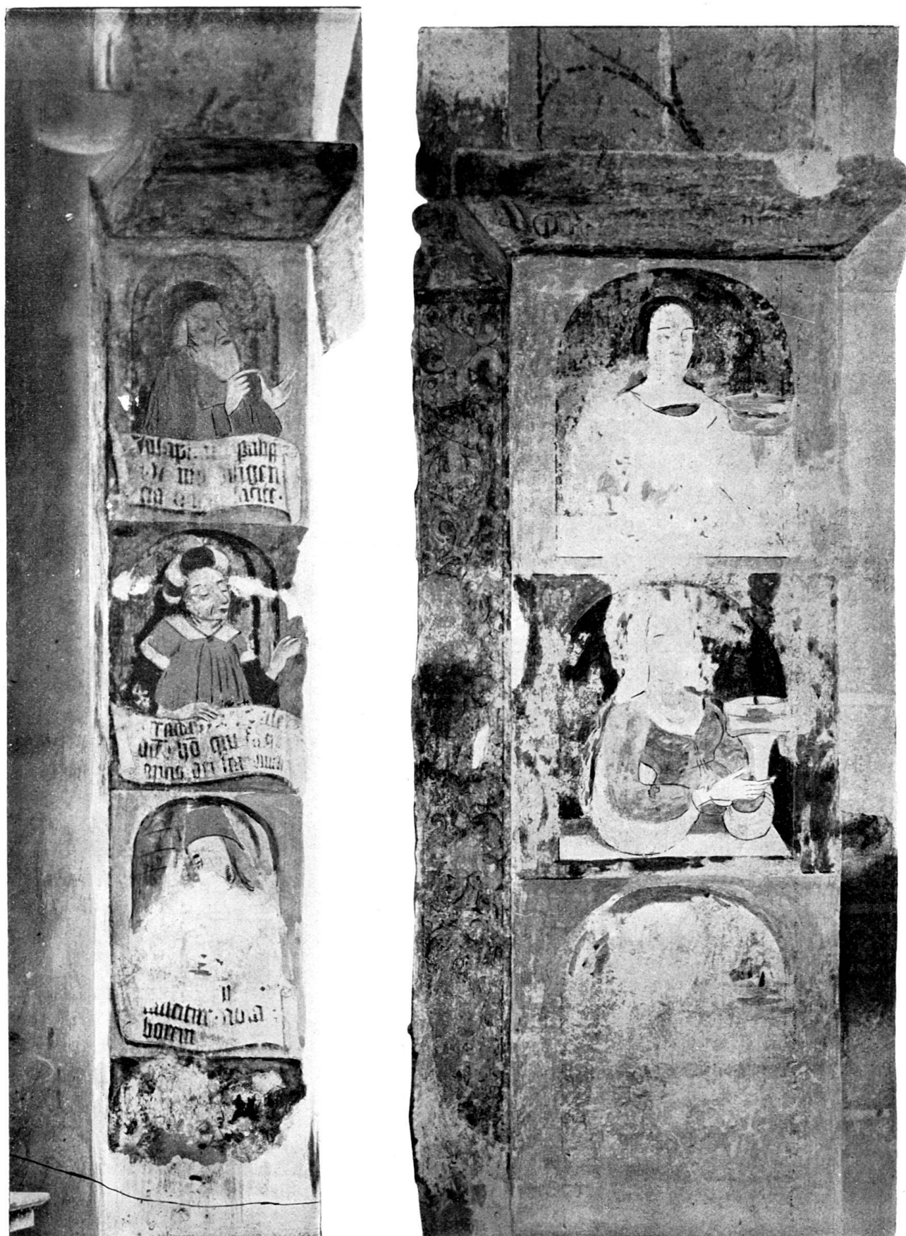
Wandgemälde am Chorbogen der Klosterkirche von Rütli.