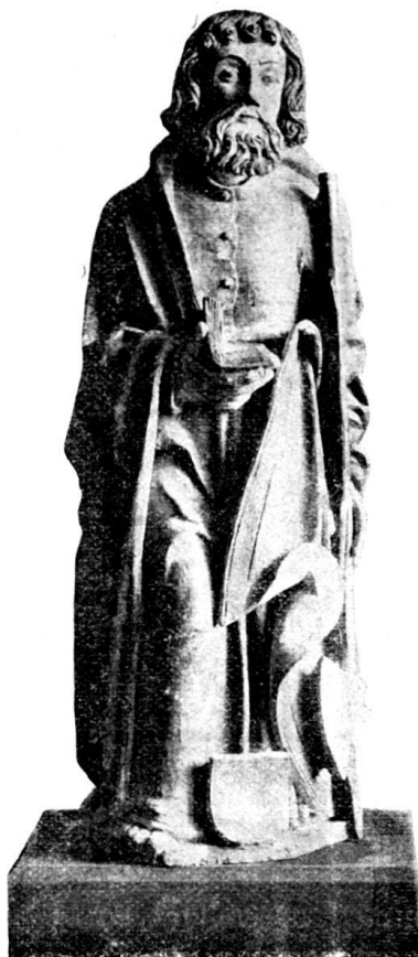
Fig. 60. S. Matthaeus. Terrakotta-Statue aus Sènedes im histor. Museum in Freiburg.