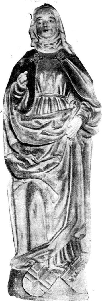
Fig. 59. S. Anna. Terrakotta-Statue im Kloster Maigrange, Freiburg.

relief von 1518 von der gleichen Hand geschaffen wurde. Einen eigenen Brennofen besaß dieser Bildhauer wohl nicht; er wird die Statuen modelliert und einem Hafner zum Brennen übergeben haben.