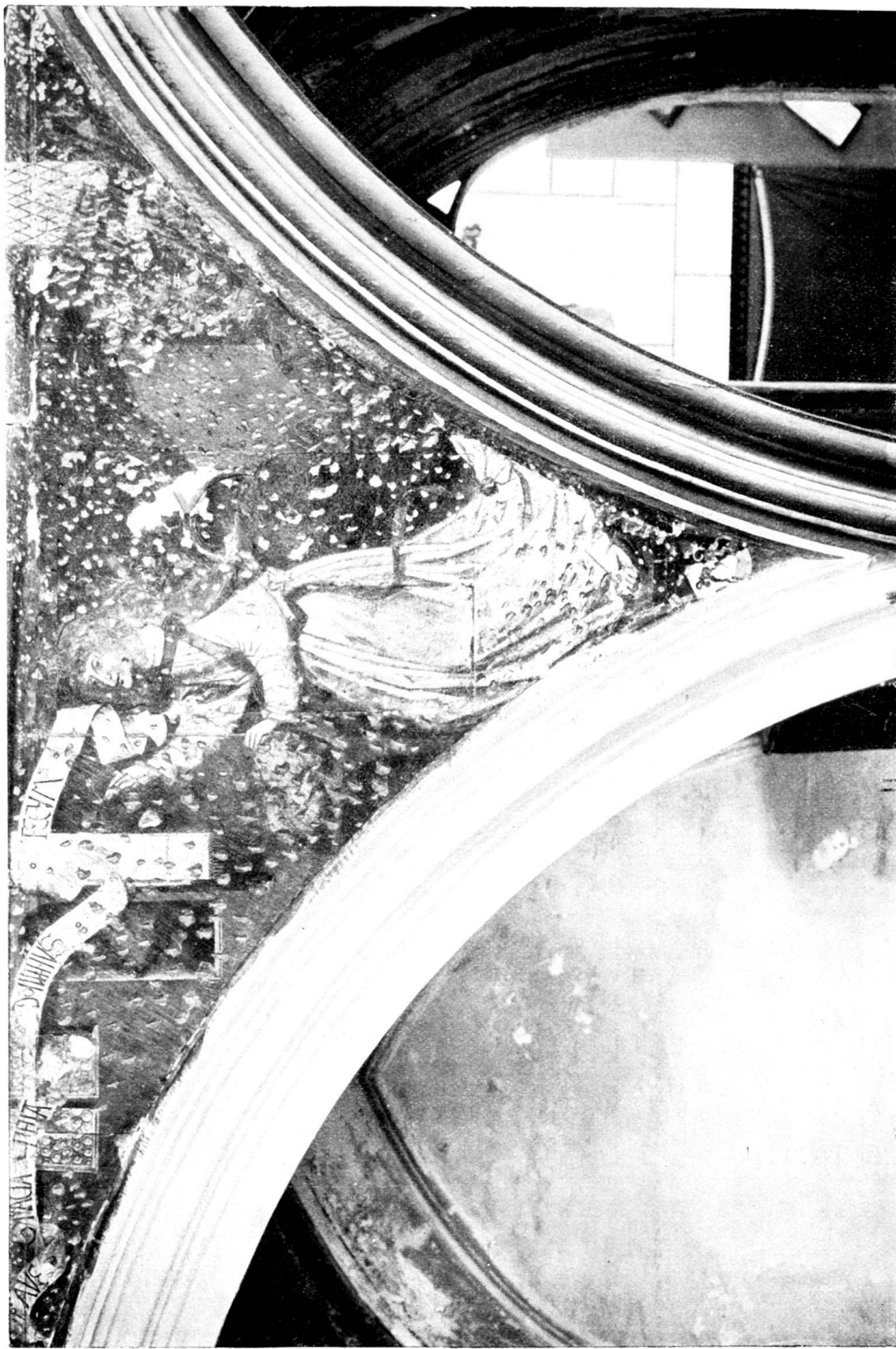
Wandgemälde am Lettner der Dominikanerkirche zu Bern.