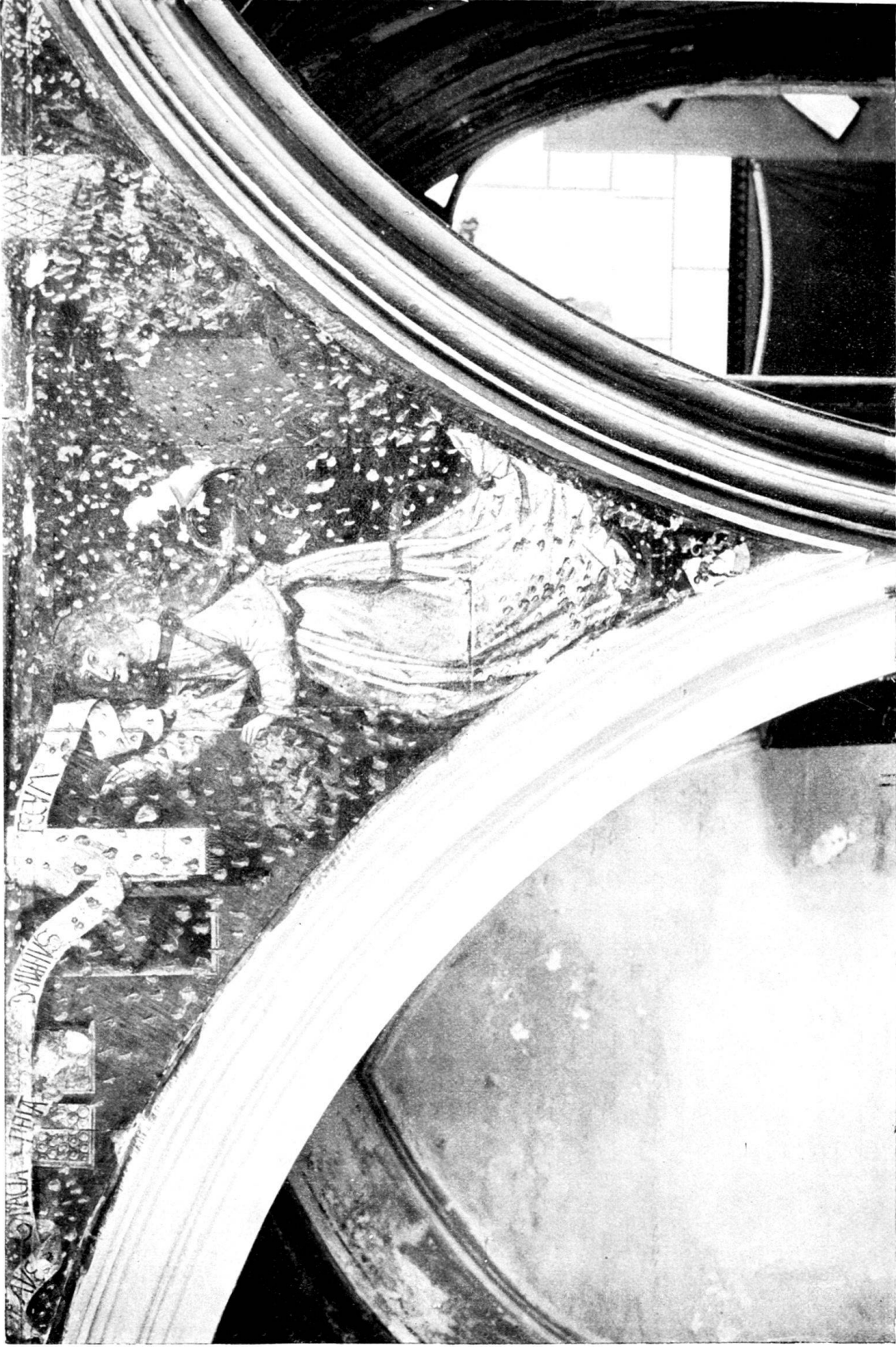
Wandgemälde am Lettner der Dominikanerkirche zu Bern.