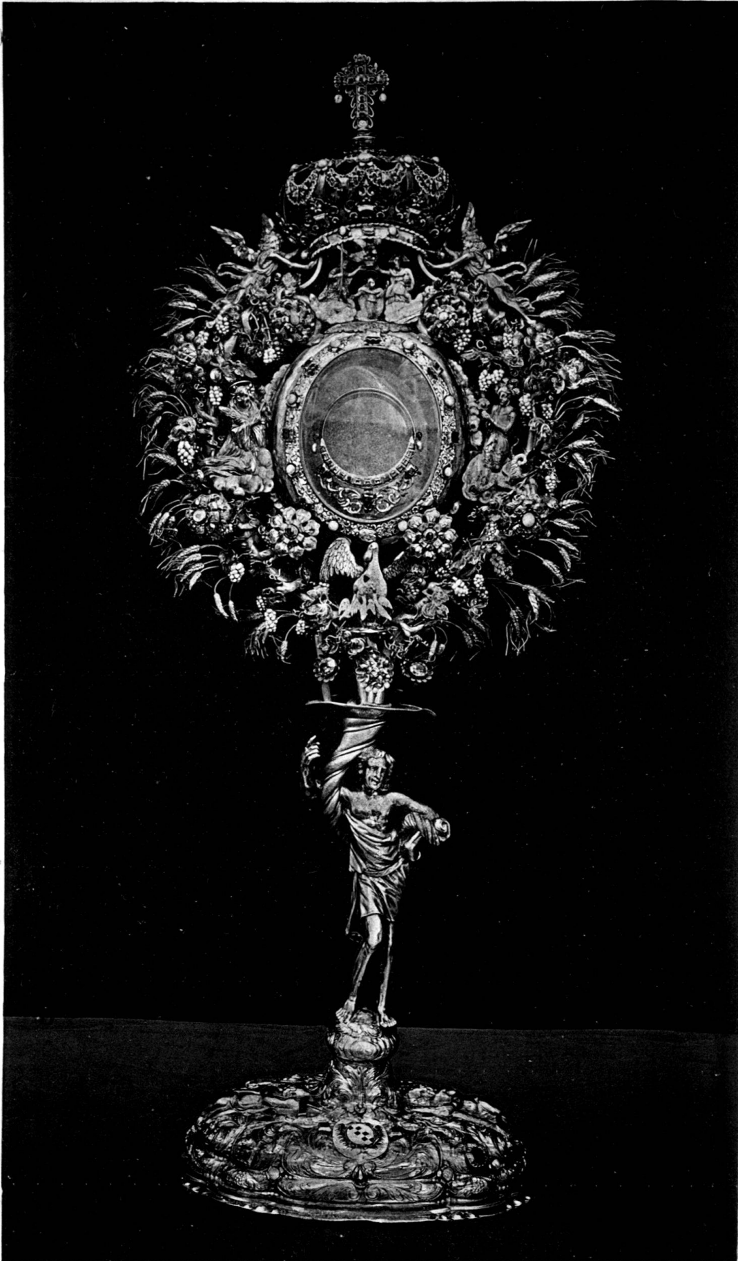
Monstranz aus Rathausen.