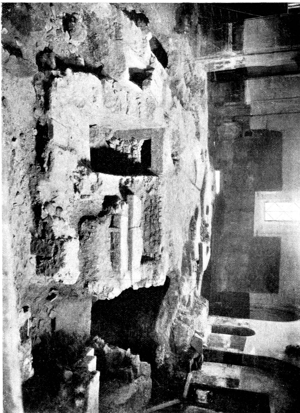
Fig. 25. Chor der jetzigen Kirche während der Ausgrabungen. Man sieht zu vorderst (von rechts nach links), den südlichen Seitengang, hierauf einige der zum Altar emporführenden Stufen, dann den alten Westeingang, einen Sarkophag, und zu äußerst links den aufgebrochenen nördlichen Seitengang.