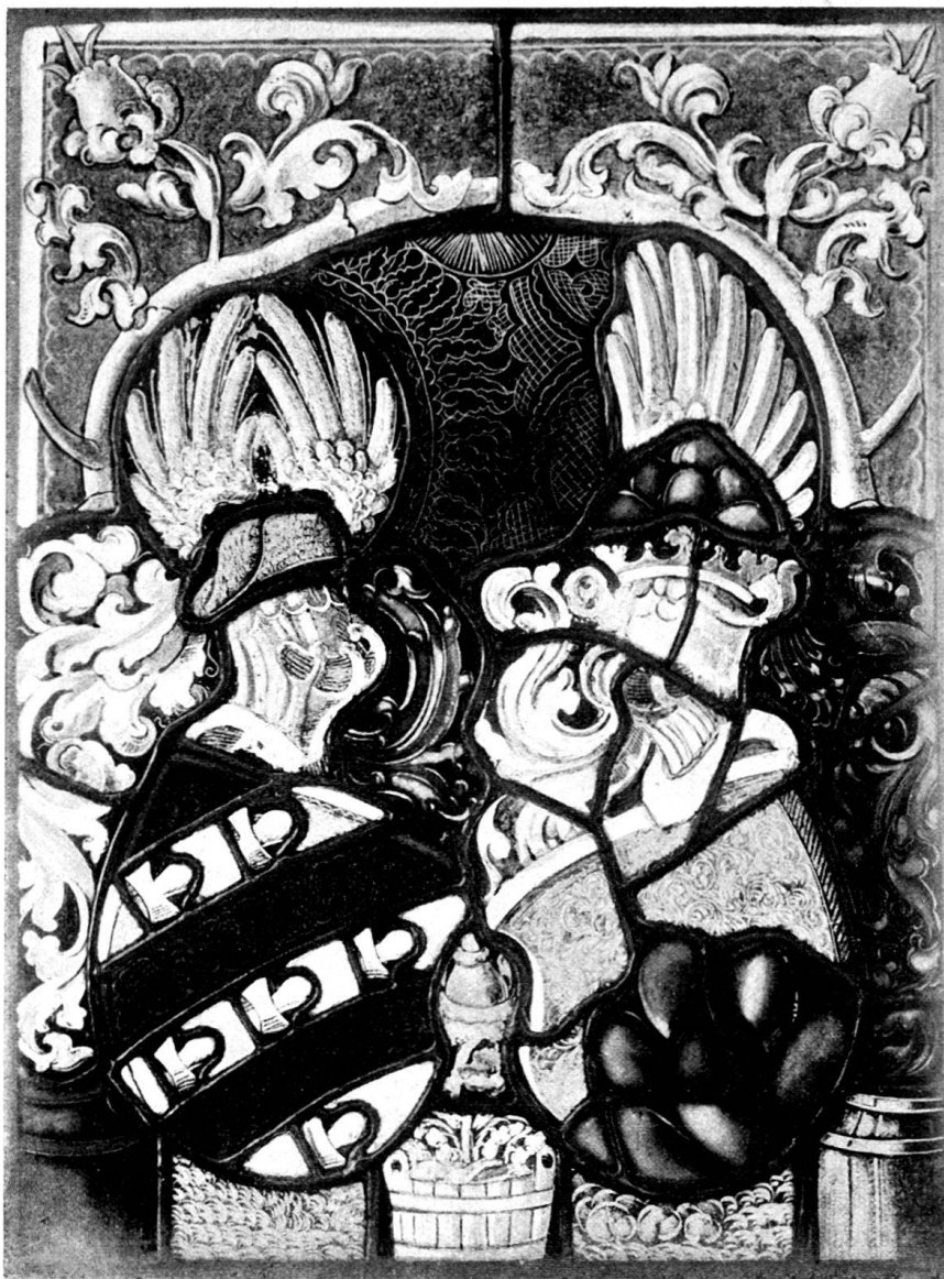
Fig. 70. Wappenscheibe des Georg von Büttikon und der Küngold Effinger, c. 1520. (Schweiz. Landesmuseum).

schaftsherren in das Kirchlein zu Rued ihre Wappenscheiben stifteten. Beide sind nach dem gleichen Entwurfe von demselben Meister ausgeführt.