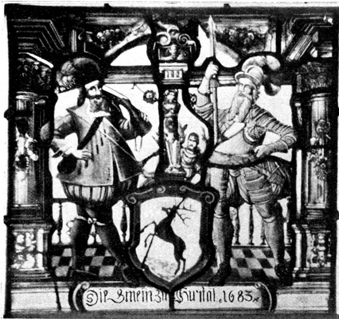
Fig. 69. Wappenscheibe der Gemeinde Hirschthal, datiert 1683, in der Kirche von Schöftland.