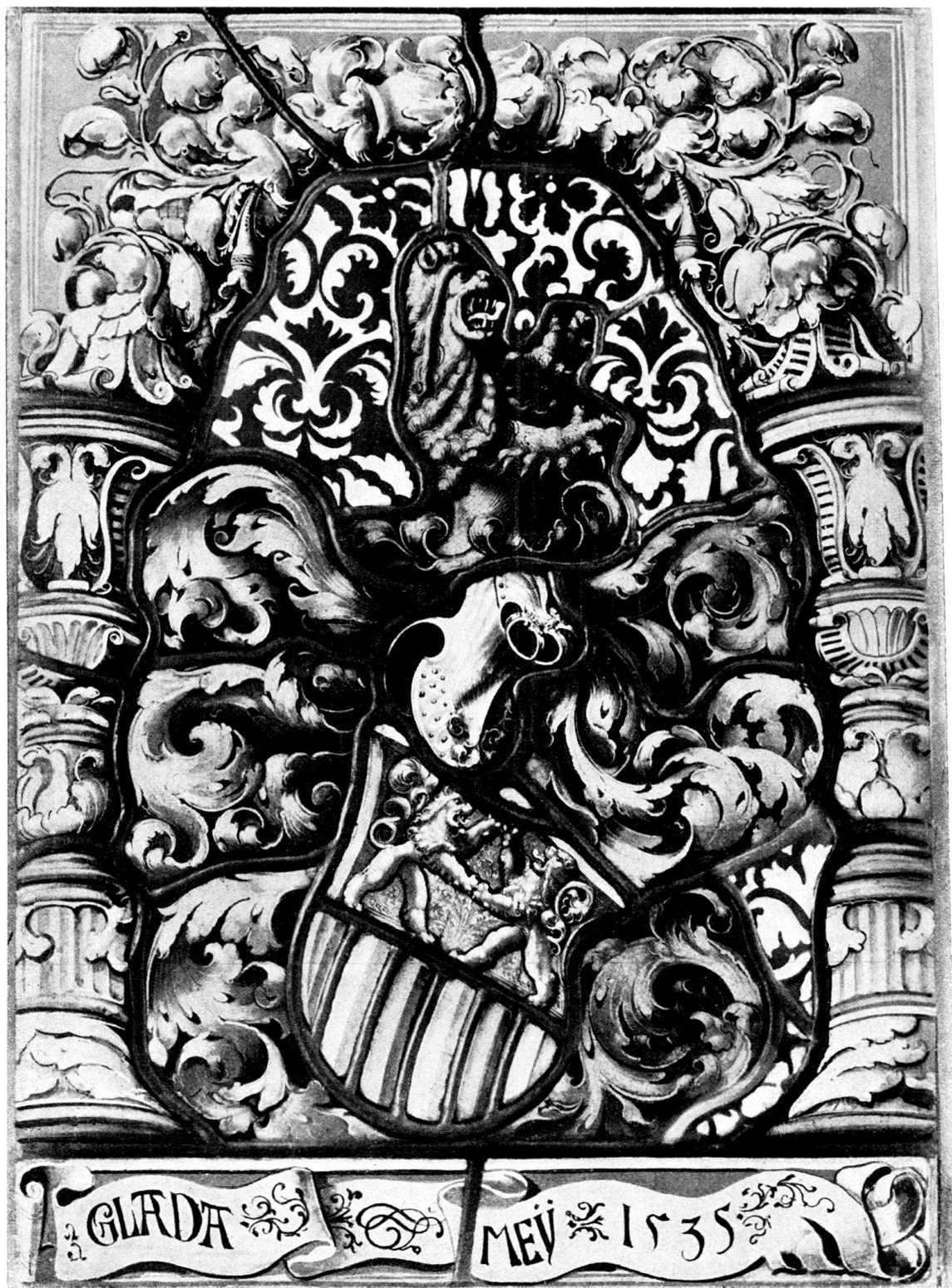
Wappenscheibe des Claudius Mey, 1535.