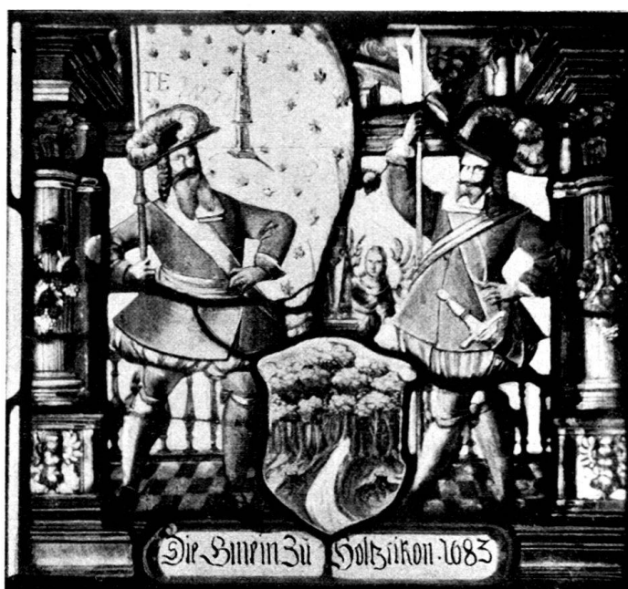
Fig. 68. Wappenscheibe der Gemeinde Holzikon, datiert 1683, in der Kirche von Schöftland.

Offenbar stifteten bei diesem Anlasse auch die umliegenden Nachbargemeinden ihre Wappenscheiben in die Kirche. Davon blieben noch vier erhalten, da ein Hagelwetter zu Ende des 18. oder Anfang des 19. Jahrhunderts einen Teil der Glasgemälde zerstörte. 1) Es sind interessante Beispiele der Bauernheraldik aus später Zeit, unseres Wissens die einzigen Dorfgemeinde-Scheiben im Kanton Aargau.