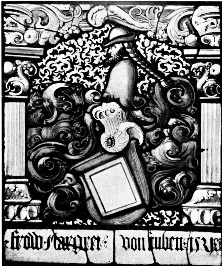
Fig. 67. Wappenscheibe von Stuben, datiert 1521, in der Kirche von Schöffland.

Zwischen massigen Pilastern, die oben durch entsprechend schweres, stahlblaues Roll- und Laubwerk verbunden werden, steht auf grün-schwarzem