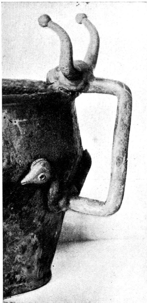
Fig. 165. Henkel eines Bronzegefäßes aus Giubiasco (Grab 262). Schweiz. Landesmuseum.

Ein anderer Fundort von Stierköpfen mit Kugelhörnern ist das La Tène-Gräberfeld von Giubiasco im Kanton Tessin. Im Grabe 262 fand sich ein