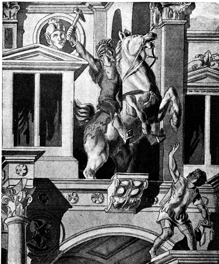
Fig. 188. „Der Reiter“. Motiv aus der von Holbein gemalten Façade des „Hauses zum Tanz“ in Basel.

Modelle der beschriebenen Anordnung müssen den vielfach geschilderten, gewaltigen Eindruck auf die Zeitgenossen ausgeübt haben; es ist wohl