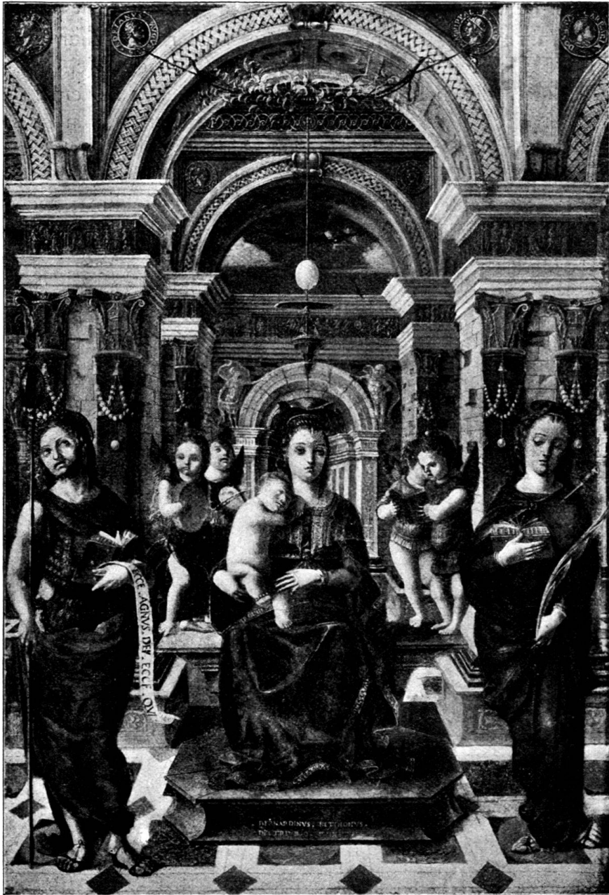
Fig. 186. Bernardino Butinone, Madonna mit Heiligen. (Isola Bella, Gräfl. Borromeo'sche Sammlung.)

Als der Schweizermaler um das Jahr 1517 in Mailand eintraf, stand das dortige Kunstleben längst schon unter dem Zeichen des Lionardo. Von den namhafteren Meistern der ältern Richtung lebte einzig noch Ambrogio Borgognone; Bernardino dei Conti war, wenn Lermolieff mit seiner Zuweisung (kunstkrit. Studien, Galerie Borghese 248 ff.) das Richtige getroffen, zur Fahne des Lionardo übergegangen. Wie aber in den Niederlanden selbst unter der Herrschaft des krassesten Italismus die Tafelbilder der Eyck-Schule als kostbarer Besitz immerfort hoch gehalten wurden, so hat auch im alten