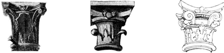
Fig. 187. Kapitellformen bei Butinone und Holbein.

„Basler Zeitschrift für Geschichte und Altertumskunde“, IV 27). Schließlich mag noch die amüsante Genesis eines Holbein'schen Kapitell-Details vorgeführt sein: Vom korinthischen Stil hatte die italienische Renaissance jene blumenartige Zierform übernommen, die aus dem Kapitell herauswächst und den Abacus überschneidet. Butinone pflegte der Zierform die Gestalt eines Cherub zu geben, ein Motiv, das Holbein derart fleißig nachahmte, bis unter seinen Händen der Cherubkopf in ein banales vegetabilisches Ornament ausartete.