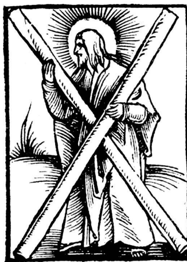
37. Urs Graf. N. 348; br. 0,042; h. 0,0575.

348. Andreas, nach halb l. v., Kopf nach l. Profil. Bei höchst einfachen Mitteln sind Licht und Schatten so kräftig und klar gesondert und in Umriß und Gewandung eine so maßvolle Schönheit entwickelt, daß dies malerisch weiche Blatt für mein Empfinden von keinem anderen Holzschnitt Grafs darin übertroffen wird. br. 0,042, h. 0,0575.