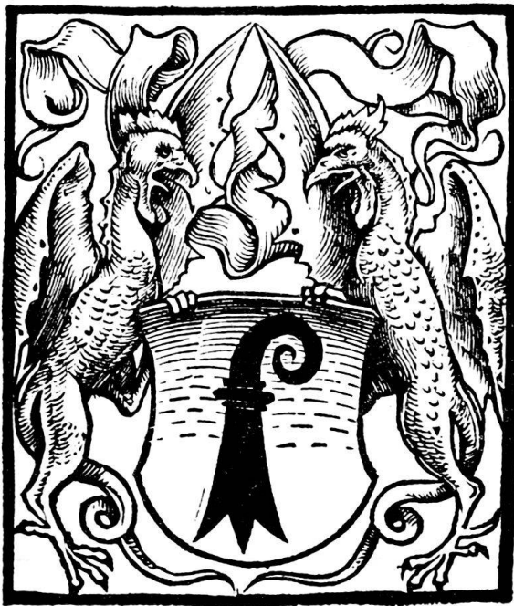
36. Urs Graf, Nr. 328 (1509); br. 0,0686; h. 0,0787.

328. Tartsche mit Baselstab, von zwei Profil nach innen stehenden Basilisken gehalten, oben leeres Band. In: Biblia cum pleno apparatu, Basel, Petri u. Froben 1509. fol. — br. 0,0686, h. 0,0787.