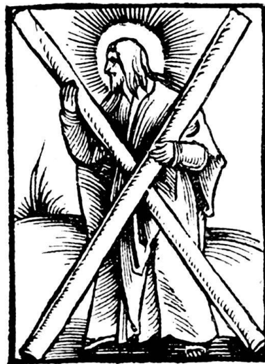
37. Urs Graf. N. 348; br. 0,042; h. 0,0575.

348. Andreas, nach halb l. v., Kopf nach l. Profil. Bei höchst einfachen Mitteln sind Licht und Schatten so kräftig und klar gesondert und in Umriß und Gewandung eine so maßvolle Schönheit entwickelt, daß dies malerisch weiche Blatt für mein Empfinden von keinem anderen Holzschnitt Grafs darin übertroffen wird. br. 0,042, h. 0,0575.