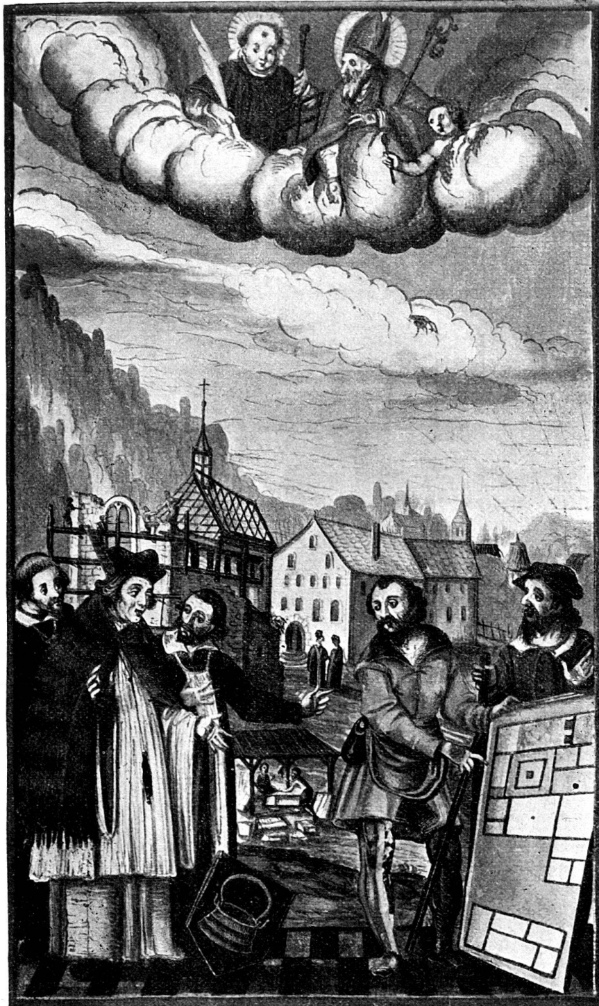
74. II ème miniature. (Fin du XVI e siècle.)

A la richesse de son costume, nous devinons l'architecte dans cet homme qui soutient le plan. Sa tunique est violette avec col et doublure de