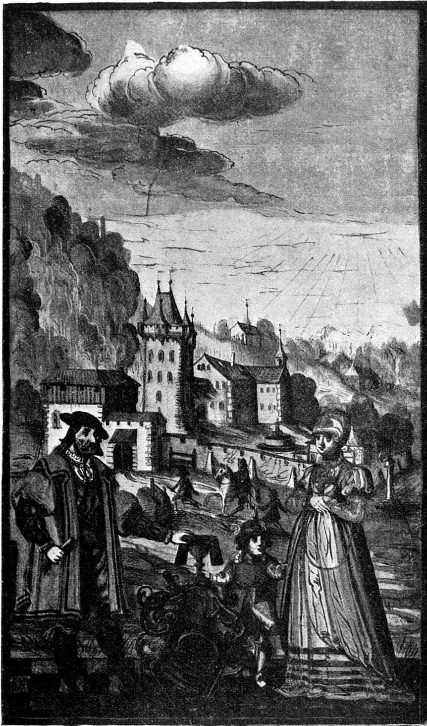
73. 1ère miniature. (Fin du XVI e siècle.)

Reste une dernière hypothèse, très vraisemblable. La chronique de la