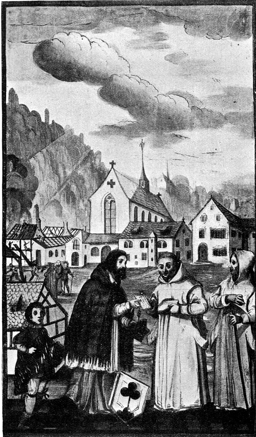
75. III ème miniature. (Fin du XVI e siècle.) Les Chanoines réguliers d'Ittingen vendent leur monastère à des Chartreux.

Au second plan on voit un groupe de deux Chartreux et d'un laïque, puis des ouvriers qui achèvent les constructions.