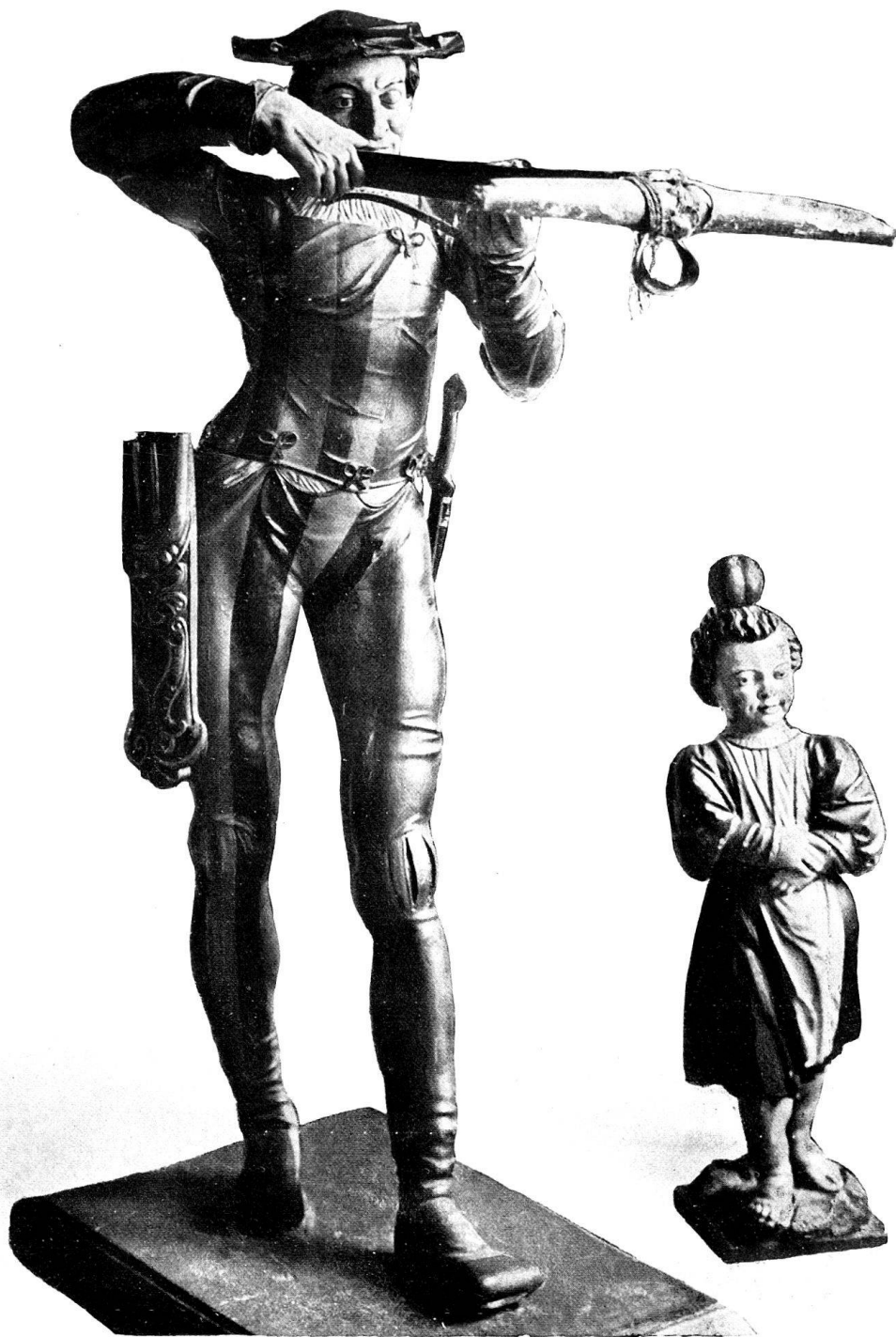
TELL UND SEIN KNABE.