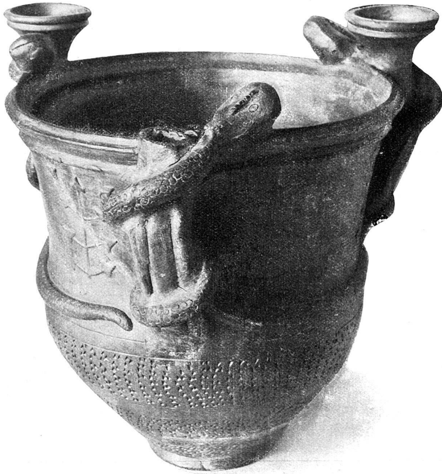
17. Mithras (?) -Vase.

Durchmesser (Abb. 16). Sie stellt den schuppigen Leib einer Schlange dar, der in zwei gegen einander gerichteten Schlangenköpfen endet. Der eiserne Dorn ist ebenfalls erhalten. Wir fanden ferner einen eisernen Dolch, der beidseitig eine Blutrinne aufweist, und dessen Griffende noch in der kupfernen