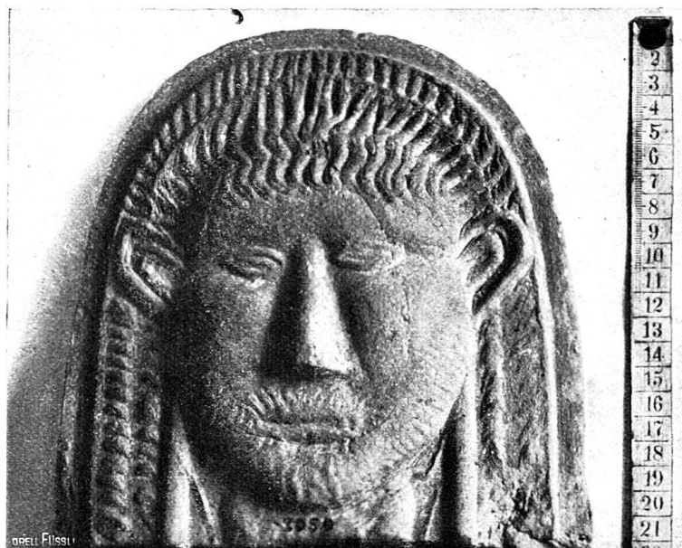
18. Stirnziegel aus dem Schutthügel.

Wenn das Basler Gefäß wirklich bei diesem Kultus diente, so ist es ganz zweifellos, daß auch unser Topf zu gleichen Zwecken verwendet wurde. Dann müßte man aber auch schließen, daß der Mithraskult, von dem man bis anhin annahm, daß er erst im zweiten Jahrhundert in Deutschland und Helvetien eindrang, schon in der zweiten Hälfte des ersten Jahrhunderts in Vindonissa und wohl auch in Augst Boden gefaßt hatte. Da bis jetzt im Schutthügel weder eine Münze noch sonst irgend ein Stück gefunden wurde, das nicht aus dem ersten Jahrhundert stammt, müssen wir auch den Mithras- topf, wenn man ihn so nennen darf, in diese Epoche verweisen. Es läge dann auch nahe, anzunehmen, daß, als gegen Ende des ersten Jahrhunderts die römischen Truppen von Vindonissa abzogen und an den Rhein verlegt wurden, sie den Mithraskult nach Germanien mitnahmen.