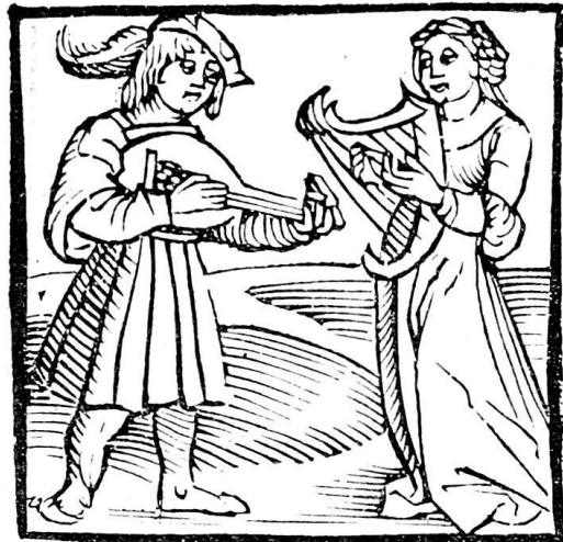
Abb. 21. Kalender von 1514, Nr. 14. (Temperamente.)