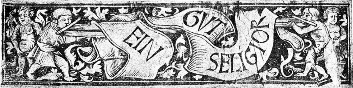
Abb. 17. Kalender für 1512; [Nr. 13. (0,194 breit.)

in Anspruch nahm, während bei dem Neujahrskind und unserer Leiste nicht mehr an Graf als Zeichner zu denken ist. Unter den Basler Zeichnern der nächst folgenden Jahre fällt durch Neigung zu besonders kurzen Unterkörpern der Zeichner der Furterschen Postilla Guillermi um 1511 auf, über den in der erwähnten Studie zu Urs Graf bei Nr. 337 auf Seite 229 und 133 einiges zusammengestellt wurde. Von diesem Zeichner hat sich auch ein 0,048 breiter und 0,062 hoher Holzschnitt, der einen vor niedriger