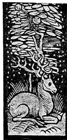
Abb. 15b. Kalender für 1512. Nr. 13.

Holzschmitte. Die erste Zeile beginnt mit demselben kalligraphischen Initial S. wie Kal. Nr. 12. Die ganze