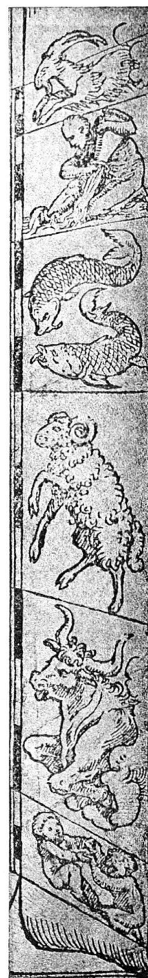
Abb. 25b. Tierkreiszeichen von 1531. (Pass. Holbein 41.)

II. Schreiber, Manuel, erwähnt unter Nr. 1906, daß sich die gleiche Zierleiste wie auf dem Londoner Kalender-Fragment (Kal. Nr. 2) auch unkoloriert auf einem Kalender von 1488 in der öffentlichen Kunstsammlung in Basel vorfinde. Dies ist aber ein Irrtum, denn der Kalender für 1488 (Kal. Nr. 3), der übrigens in der Bibliothek in Basel aufbewahrt ist, während sich nur ein Exemplar der Zierleiste in der Kunstsammlung befindet, zeigt nur eine Kopie und nicht die Originalleiste. Gestützt auf Schreiber hat Heitz in den N. W. als Nr. 31 die Basler Kopie angeblich als das Londoner Original reproduziert und aus Eigenem einen kleinen und einen großen Fehler hinzugefügt, indem er angibt, daß das Londoner Fragment für das