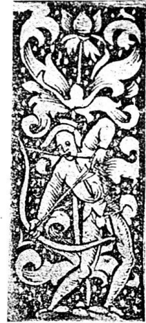
Abb. 15c. Kalender für 1512; Nr. 13 breit 0,025.

linke und untere Seite des Blattes sind mit Holzschnittleisten eingefaßt, an der linken Seite sind es zehn, welche von oben nach unten beschrieben folgendes vorstellen: a. Stehendes nacktes Christkind mit Buch unter linkem Arm (Abb. 15 a) — b. Hirsch liegt vor Baum nach rechts (Abb. 15 b) — c. Aufrechter Zweig mit Krabbenblättern und oben drei Blüten mit starken Stempeln — d. In ähnlichem Ornament nackter Knabe mit Hund an Leine nach links (Abb. 16) — e. In ähnlichem aber schwächer gezeichnetem Ornament sitzt nackter Knabe auf sehr verzeichnetem ruhendem Löwen nach links. — f. Bogenschütz steht nach links abwärts schießend vor ähnlichem Ornament (Abb. 15 c) — g. Vase aus der achterartig verschlungener Stengel aufsteigt, oben auf Blüte eine Eule. — h. Schwerfällige cylindrische Vase mit zwei kleinen eckigen Henkeln, Krabbenblattwerk wie bei den übrigen Leisten. — i. Fragment einer zu dieser Reihe gehörigen Leiste, erhalten nur das obere Ende mit einer Eule auf Ast nach vorn rechts. — k. Aehnliches Ornament wie bei h, in dem man auch einige Disteln erkennen mag, steigt aus einer kleinen Vase mit eingezogenem Fuß auf.