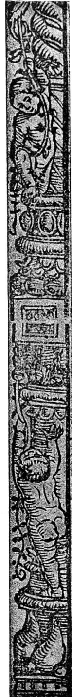
Abb. 23 b. Kalender für 1533. Nr. 17.

Holzschnitte: Die erste Zeile beginnt mit einem 0,017 breiten und 0,016 hohen