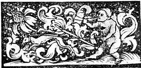
Abb. 16. Kalender für 1512; Nr. 13.

Die genannten Leisten haben alle schwarzen Grund mit weißen Tupfen und keinen besonderen (doppelten) Einfassungsstrich, sie messen 0,024 bis 0,025 in der Breite und 0,053 bis 0,059 in der Höhe, einige kommen bei Furter schon 1507 und wohl noch etwas früher vor. An der unteren Begrenzung des Blattes sind von links nach rechts beschriebene folgende Holzschnitte angebracht: l. Furter Signet = Heitz und Bernoulli, Basler Büchermarken Nr. 19. — m. „Ein Gut Selig Jor“ 0,194 breit und 0,045 hoch (Abb. 17) — n. Halbfigur eines Gelehrten aus Blattkelch nach rechts (0,022 breit; 0,03 hoch) — o. Nacktes Weibchen (Planetenfigur) nach links schreitend (0,021 br.; 0,04 h.; n und o; Abb. 18) — Die Neujahrswunschleiste ist in ihrer dekorativen Auffassung von Vorlagen wie der in den N. W. als Nr. 44 reproduzierten etwas abhängig, aber sie ist äußerst unsicher gezeichnet mit ihren wurstartig formlosen Knien und verkümmerten