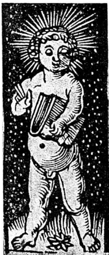
Abb. 15a. Kalender für 1512. Nr. 13.

Inhalt. Allgemeine Jahresbeschreibung. Der Kalender ist ein Tageskalender, die Monate sind hier, um das überlange Format zu vermeiden, nur zu dreien unter einander und zu vieren nebeneinander angeordnet, jeder Monat in zwei Spalten. Am Kopf der linken Spalte steht der Name des Monats in Rotdruck (Monatsbilder fehlen in diesem Kalender), am Kopf der rechten Spalte ebenso die Anzahl der Tage. In der linken Spalte stehen die Namen der Tage und ihre Bezeichnung mit je a bis g wie in den Kalendern Nr. 10 und 12, aber hier kommt zum ersten Mal auch die Datierung von 1 bis 31 hinzu. In der rechten Spalte steht bei jedem einzelnen Tag