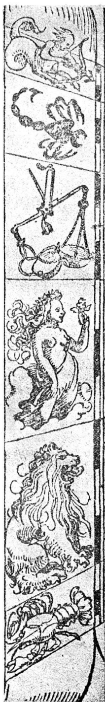
Abb. 25a. Tierkreiszeichen von 1531. (Pass. Holbein 41.)

Armenspital zu Basel gelegenen Kapellen der Trinität und St. Michaels, welche mit der gleichen Type gedruckt sind wie Proctor 7788 B und 7789. Von dem Ablass zu Gunsten des Basler Spitals, den Sixtus IV. 1483 ver-