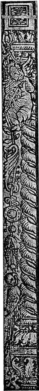
Abb. 23 a. Kalender für 1533. Nr. 17.

Unbeschrieben. — Ueber die Holzschnitte vgl. Beiheft zum Jahrbuch der Kgl. Preussischen Kunstsammlungen 1907, Seite 109, Nachtrag zu Nr. 52. — Exemplar: Bern, Stadt B.