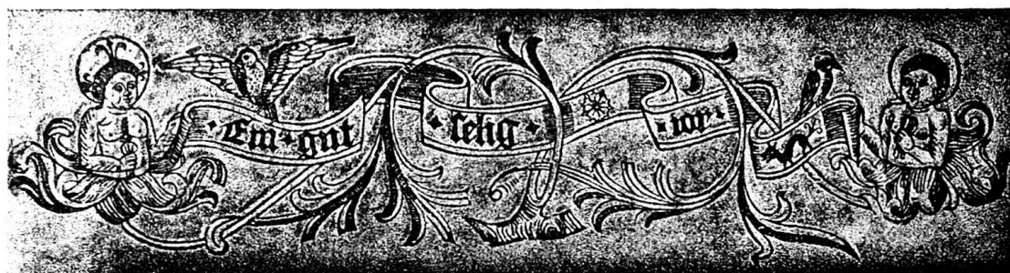
Abb. 14. Neujahrswunsch des Kalenders für 1505, Nr. 12. (Originalgröße 0,185 breit und 0,041 hoch.)

Nr. 13. Johannes Rüß: Deutscher Wandkalender für 1512. Fragment. Basel: Michael Furter. Plakatformat.