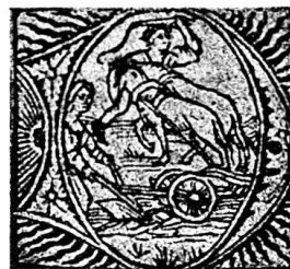
Abb. 13. Monatsbild (F.) des Kalenders für 1505, Nr. 12,

Holzschmitte. Abgesehen von einer hier hinzukommenden vollständigen Eklipse und der Fußleiste mit dem Neujahrswunsch, entspricht die Anlage des Blattes ganz der von Kalender Nr. 10. Die Überschrift beginnt mit einem 0,027 breiten und 0,028 hohen kalligraphischen Initial S., jeder Monat beginnt in der linken Spalte mit dem Monatsbild im Initial D. Die 0,031 breiten und 0,029 hohen Monatsbilder (Abb. 9) kamen teilweise schon bei Ysenhut 1498 in Kal. Nr. 9 vor, hier erscheinen dazu neu alle vom Jenner bis May und ein anderes Initial für den Brachmonat (Abb. 13). Dieses und das April-D. haben geflammte und gestrahlte Quadrastecken auf weißem Grund, alle anderen Blattwerk auf schwarzgrundigen Ecken. Die 0,185 breite und 0,041 hohe Fußleiste mit dem Neujahrswunsch (Abb. 14) ist eine recht gute Kopie nach der Leiste des Kalenders Nr. 2. Hatte C. Dodgson (Catalogue I. Seite 119) schon die Ähnlichkeit der Leiste des Kal. Nr. 2 von 1487 mit der in den N. W. als Nr. 29 abgebildeten hervorgehoben, so gilt das noch mehr von der vorliegenden Leiste.