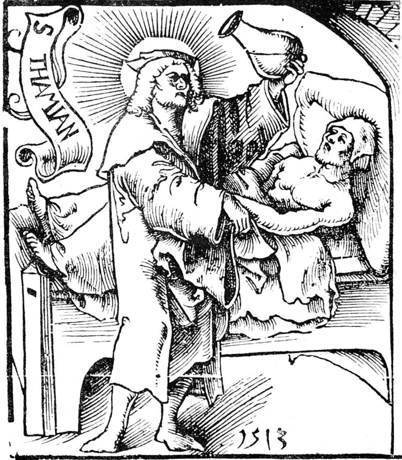
Abb. 22. Kalender von 1514. Nr. 14.

Basel: Pamphilus Gengenbach. 4 o . Signaturen von AII bis K III. III. Init. Leisten. Dr.-M. (?) Tit.: (D) Iser kalēder zeygt dir clarlīchen die eygeschafft vnd natur der syben Planeten. Zwölff zaiçhē... Endet: Also hastu den Kalender, der do volendet ist uff Frytag vor Johannis. in M. CCCCC. XXI. P. G.