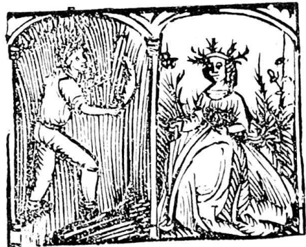
Abb. 19. Kalender von 1514. Monatsbilder H.

Holzschnitte. Das Kalenderbuch beginnt mit dem eigentlichen Kalender auf 12 Blättern, zu Beginn der Vorderseite eines jeden Blattes ist links von der Monatsüberschrift das 0,049/0,051 breite und 0,037/0,038 hohe Monatsbild, jeweils zweigeteilt, links die Monatsverrichtung, rechts das Tierkreiszeichen (Beispiel siehe Abb. 19). Die Kompositionen sind ähnliche, aber geringer gezeichnete Kopien der Monatsbilder des um 1490 in Kirchheim im Elsaß gedruckten Gebetbuches: „Hore nostre domine scdm usuz || ecclesie romane . . . “ (Proctor 3209, Copinger II. 3068, Serapeum 2, Seite 219, Nr. 1, Exemplar in Basel.) Außer diesen größeren Monatsbildern kommt auf jeder Vorderseite des eigentlichen Kalenders noch rechts neben der Kolonne der Monatstage ein kleines Tierkreiszeichen in Rund vor, das von Urs Graf gezeichnet ist (Durchmesser 0,02). Dieselben kleinen Tierkreiszeichen umgeben auch den gleich noch zu erwähnenden Aderlaßmann. Es folgt zunächst eine Tafel zur Auffindung des Sonntagbuchstaben und eine zur Bestimmung, in welchem Zeichen der Mond sei; dann der 0,097 breite und 0,105 hohe Aderlaßmann von Urs Graf; ferner eine Tafel, worin man die 12 Zeichen des Mondes findet und was man in jedem Zeichen tun soll. Das nächste Kapitel 1) ist mehrere Seiten stark: „Die zwelff natürlichen