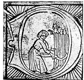
Abb. 26. Der August (Monatsbilder A.)

A. 0,038 im Quadrat, einfache Quadrateinfassung, das D doppelt eingefast, Grund in den Ecken schwarz mit Ornamenten, nur beim August weiß mit Strahlen. Es fehlen Jenner und Brachmond. Die Monatsdarstellungen und die Ornamentik der Eckfüllungen sind derbe Kopien im gleichen Sinn von den Knoblochzer Initialen von 1483, hier mit richtiger Reihenfolge der Bilder, während der Knoblochzer Kalender die Bilder für Merz und Juni sowie für September und Oktober miteinander verwechselt hat. Verwendet sind die Monatsbilder A. in Kal. Nr. 3 und 4.