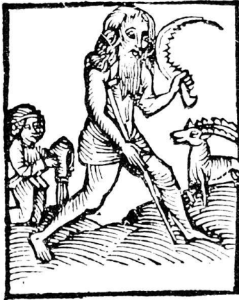
Abb. 20. Kalender von 1514. Nr. 14. (Planetenbild.)