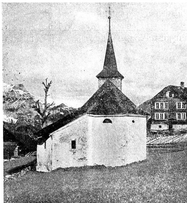
Abb. 1. Kapelle im Götschwiler.

Im Götschwiler, dreiviertel Stunden ob der Pfarrkirche Spiringen, erhebt sich in weltflüchtiger Gegend eine malerische Kapelle, deren wertvollster Kunstschatz ein Gemälde von Dionys Calvaert (1545–1619) 1) bildet, mit dem Porträtkopfe des Stifters Hauptmann und Landschreiber Azarias Püntener und der Inschrift versehen: Dionysius Calvaert Antverpien, pincit 1609. Es ist schon die Vermutung ausgesprochen worden, Calvaert, auch Fiamingo genannt, habe sich zeitweise in Uri niedergelassen und hier gearbeitet. Archivalische Beweise ließen sich bis jetzt für diese Ansicht nicht erbringen und die vielen Beziehungen der Urner