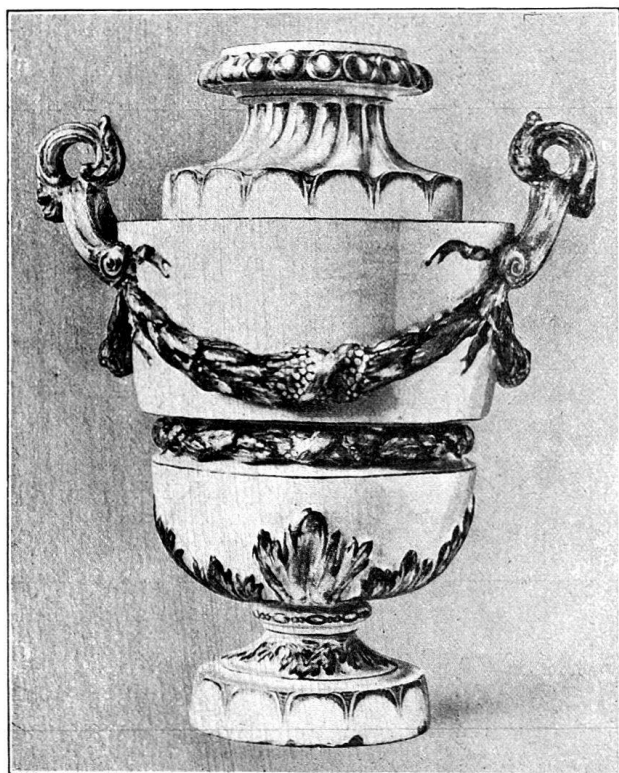
Abb. 2. Bemalte Fayencevase von Joh. Jak. Frey. Schweiz. Landesmuseum.

Es wird angenommen, die Herstellung seiner roten Farbe, die ihm eigen, zur Bemalung seiner Fayence, habe ihn mehr gekostet, als er ein-