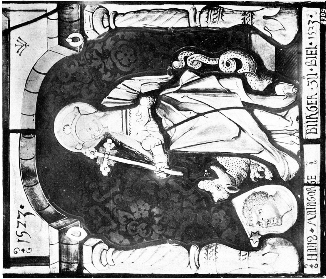
WAPPENSCHIEBE DES HANS MALAGORGE, BÜRGER ZU BIEL, 1529.

ARBEITEN DES GLÄSMALERS JAKOB WILDERMUT ZU NEUENBURG IN DER KIRCHE VON LIGERZ.