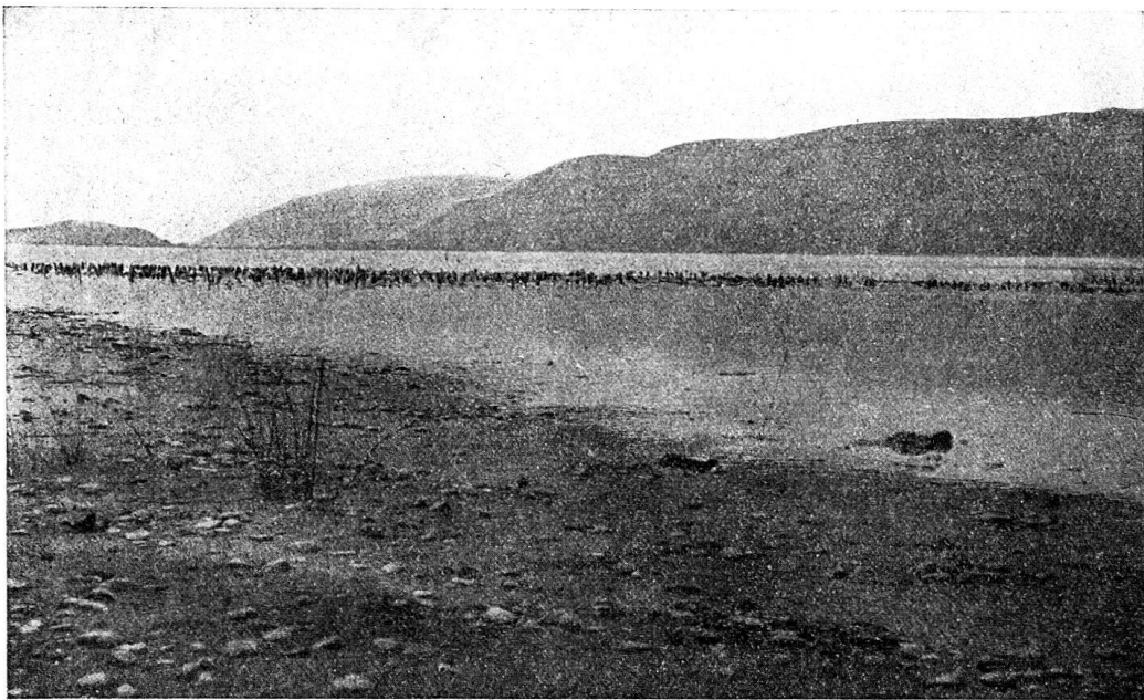
Abb. 1. Pfahlbauten bei Latterigen nach der Tieferlegung des Bielersees. Aufnahme von Bürki, 1874.

Die Pfähle, von denen hier Pagan schreibt, sind die Überreste eines erst ein Jahrhundert später in seinem Wesen erkannten Bronzefahlbaues bei Nidau. Wenn nun auch Pagan in seiner gründlichen Schrift zum ersten Male für unseren See einen Pfahlbau erwähnt, so ist er sicherlich nicht der erste, der auf die vielen mit dunklen Pfählen weithin übersäten Stellen des Sees aufmerksam geworden ist. Die Erscheinung war eine zu auffällige, als daß sie hätte ungesehen bleiben können. Mußten doch die großen Wein- und Salzschiffe, die früher in den Hafen von Latterigen und durch die Zihl bei Nidau fuhren, direkt über die Reste solch alter Pfahlbaustationen fahren und mancher Schiffsmann oder Fischer wird bei klarem, stillem Wasser verwundert vom gleitenden Schiffe aus den dunklen Pfahlwald in der Tiefe betrachtet haben. (Abb. 1).