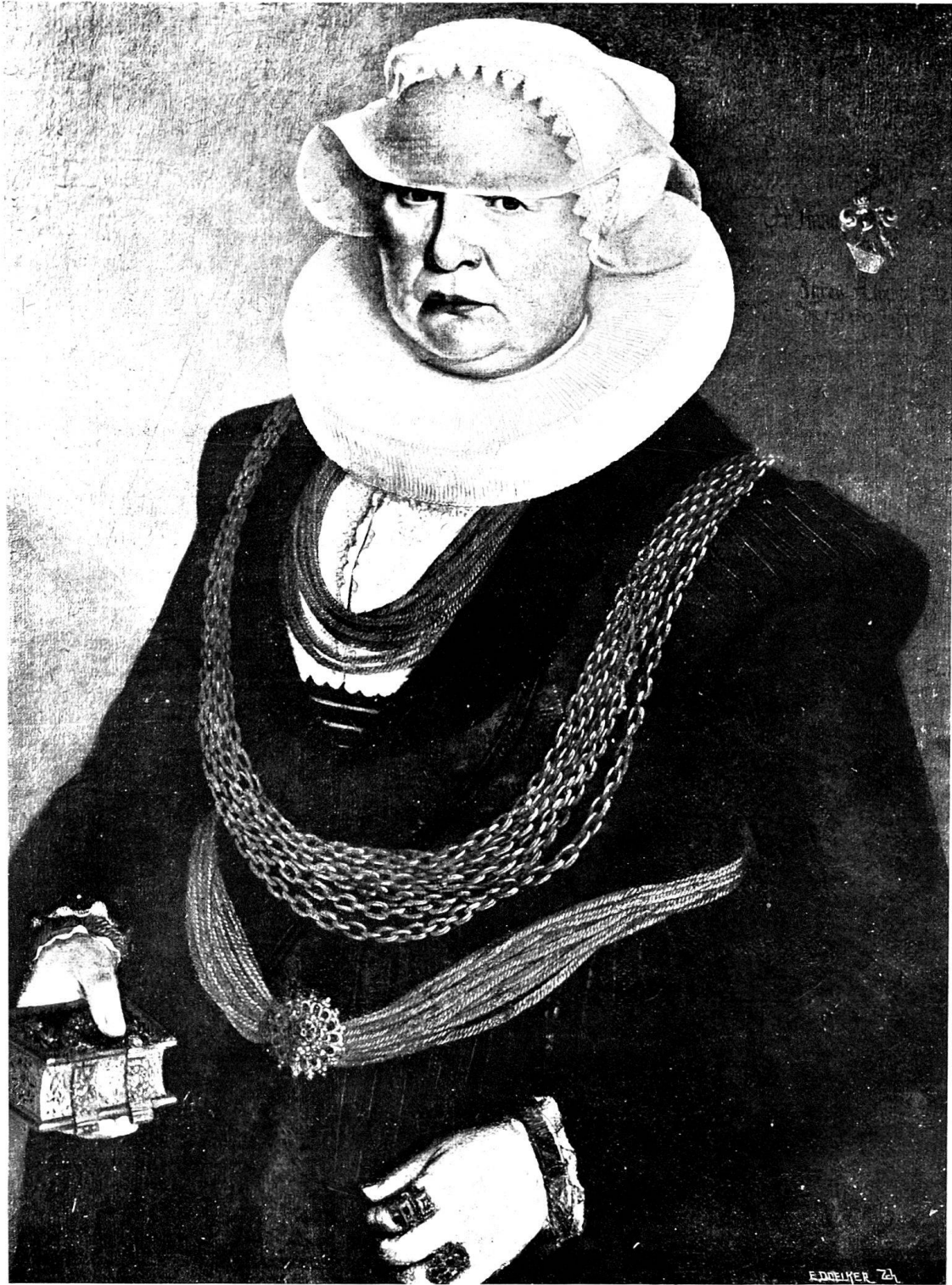
ANNA ESCHER V. LUCHS, 1660. Schweiz. Landesmuseum.