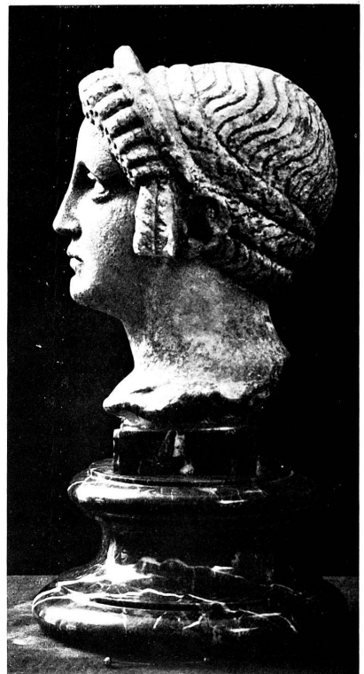
TÊTE DE FEMME ROMAINE, DE MARTIGNY.