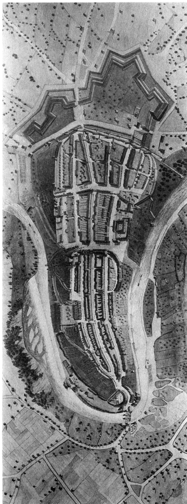
Plan der Stadt Bern, 1623 von der Nordseite.