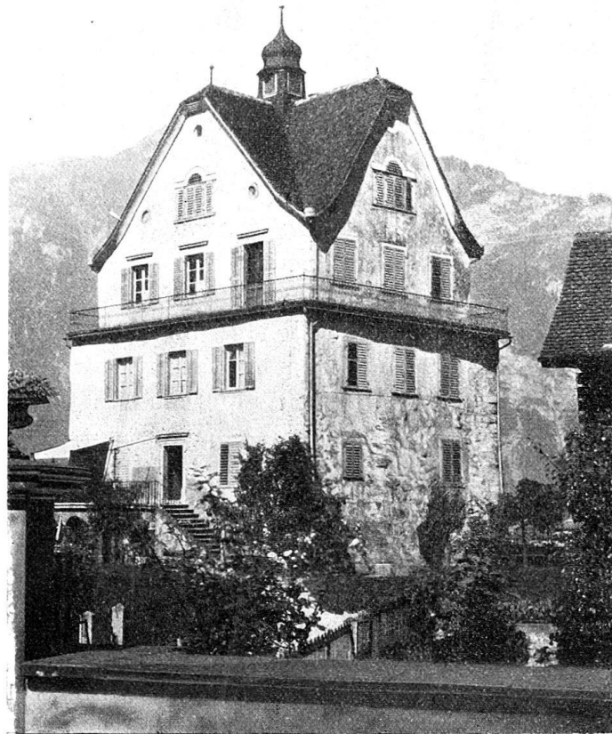
Abb. 4. Schloßchen Rudenz in Flüelen. (Aufnahme von R. Müller).

der vom Kloster sich bis zum Schloßchen Apro fortgesetzt habe. Der Gang zu Rudenz soll auch am Seeufer eine Ausmündung besessen haben Von