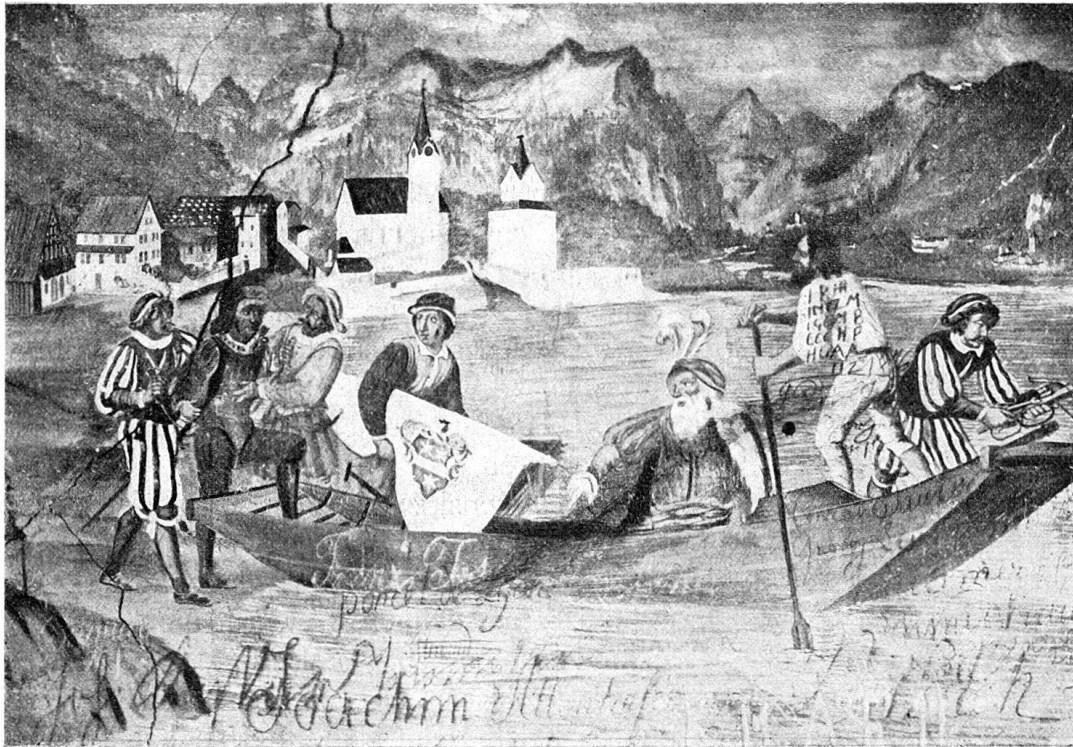
Abb. 2. Wandgemälde aus der alten Tellskapelle, von Karl Leonz Püntener, 1719; jetzt im Schlößchen Apro.

versetzt wurde. 1) (Abb. 2.) Püntener stellte die Einschiffung des gefangenen Tells in Flüelen dar und gab das genannte Dorf in seinem damaligen Aussehen mit sichtlicher Treue wieder. Die ziemlich großen Hofmauern reichen bis zum See hinab und sind dort von zwei turmartigen, aus dem rechten Winkel etwas hervortretenden Eckbauten flankiert (Abb. 3). Ob diese Mauern damals noch wirklich in dieser Höhe und in diesem Umfange vorhanden waren, bleibt dahingestellt. Der Maler hat vielleicht die vorhandenen Überreste zeichnerisch ausgebaut und rekonstruiert. So erblicken