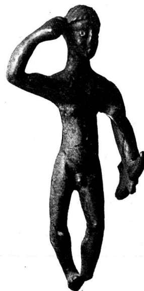
n o 4.

N o 1—10. Hercule brandissant la massue du bras droit; la main gauche tient l'arc, et la peau de lion, parfois omise (n o 8—10), repose sur le bras gauche.